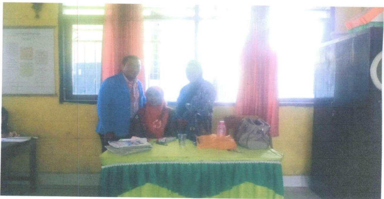
Foto bersama dengan guru kelas,SDN 12 kendari barat.