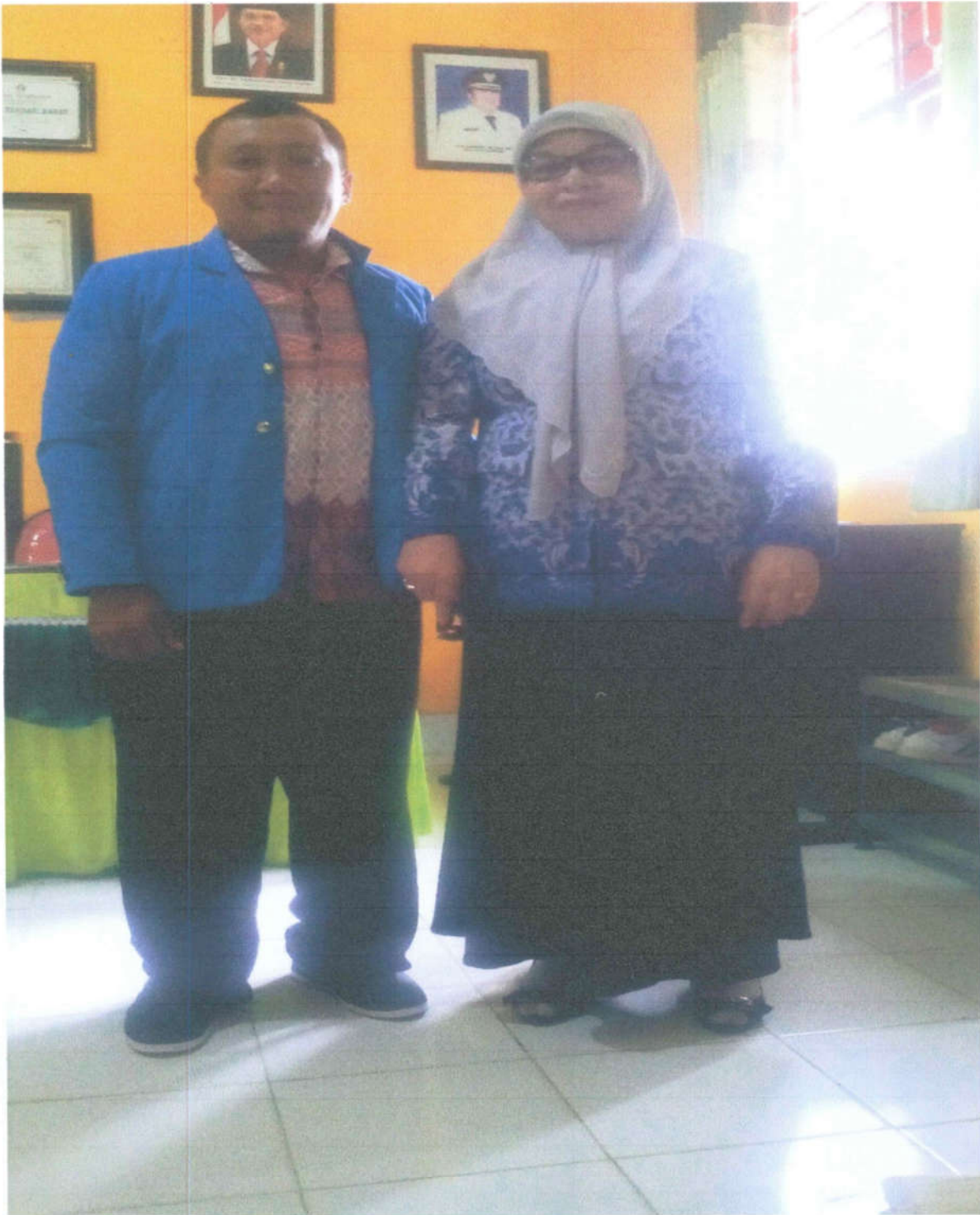
Foto bersama kepala sekolah SDN 12 kendari barat, kota kendari.