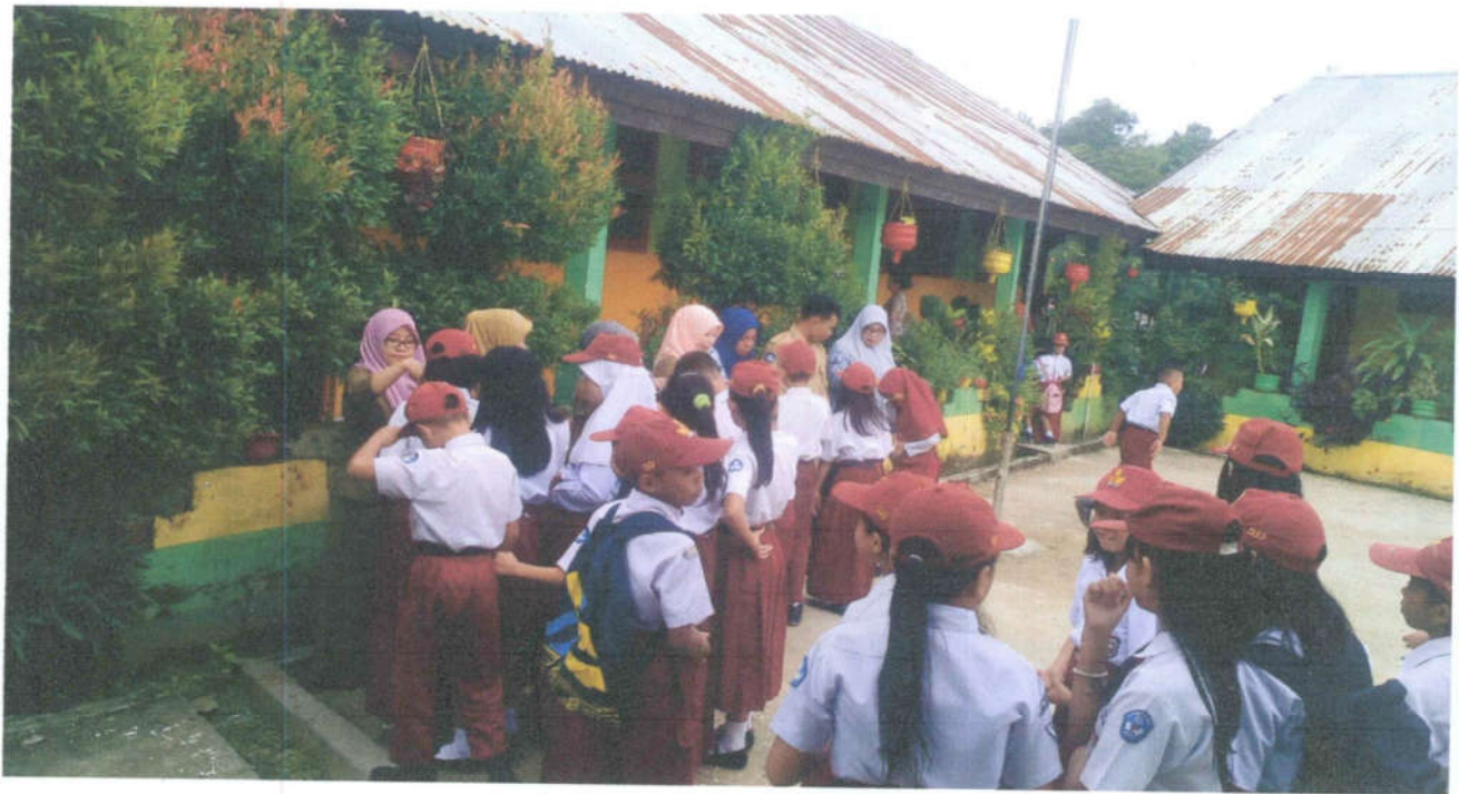
Foto guru dan siswa selesai apel pagi.