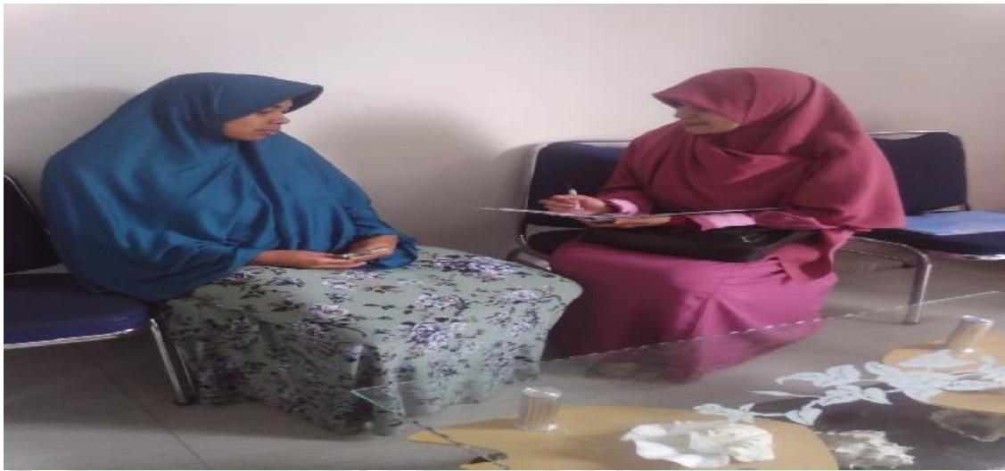
Gambar Wawancara Bersama Kepala Madrasah Aliyah Darul Mukhlisin