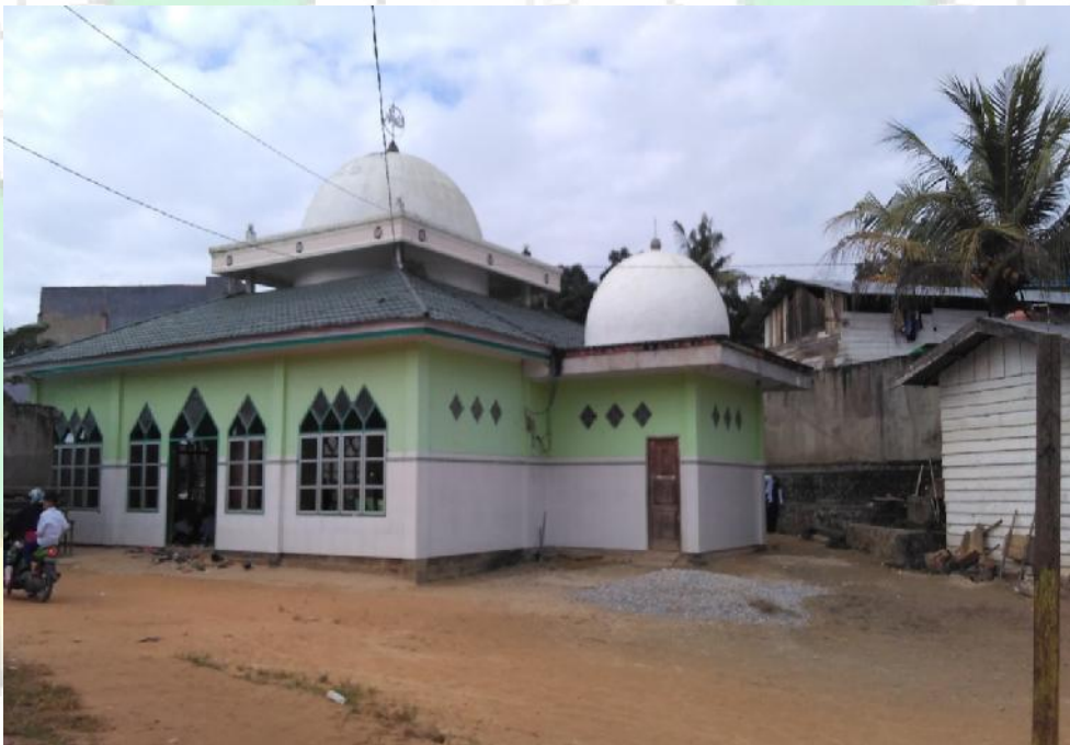
Gambar Masjid Madrasah Aliyah Darul Mukhlisin