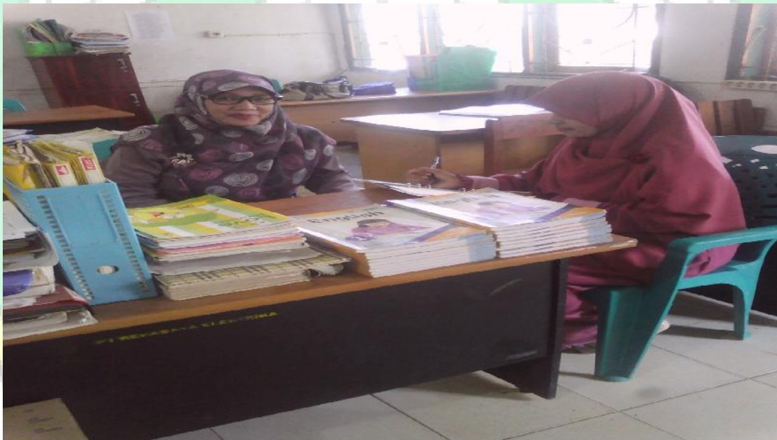
Gambar wawancara bersama Guru Madrasah Aliyah Darul Mukhlisin