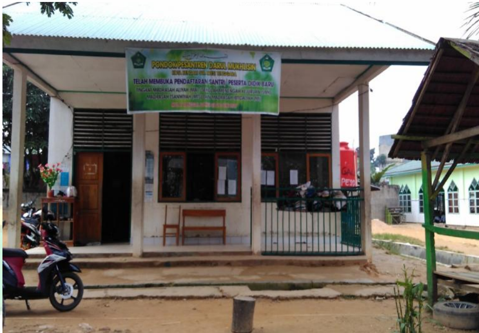
Gambar Denah ruang guru Madrasah Aliyah Darul Mukhlisin