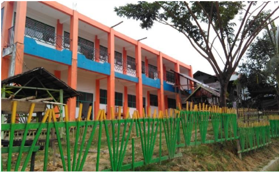
Gambar Ruang Kelas Belajar Madrasah Aliyah Darul Mukhlisin