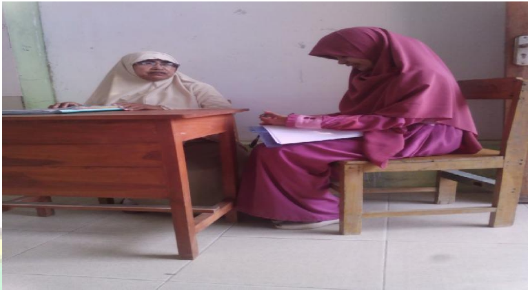
Gambar Wawancara Bersama Guru Madrasah Aliyah Darul Mukhlisin