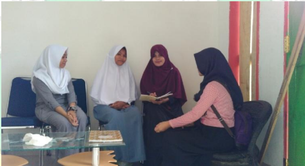
Gambar Wawancara Bersama Siswa Siswi Madrasah Aliyah Darul Mukhlisin