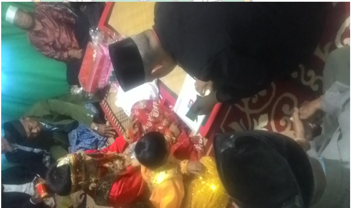
➤ Prosesi Penandatanganan Administrasi nikah oleh calon kedua mempelai