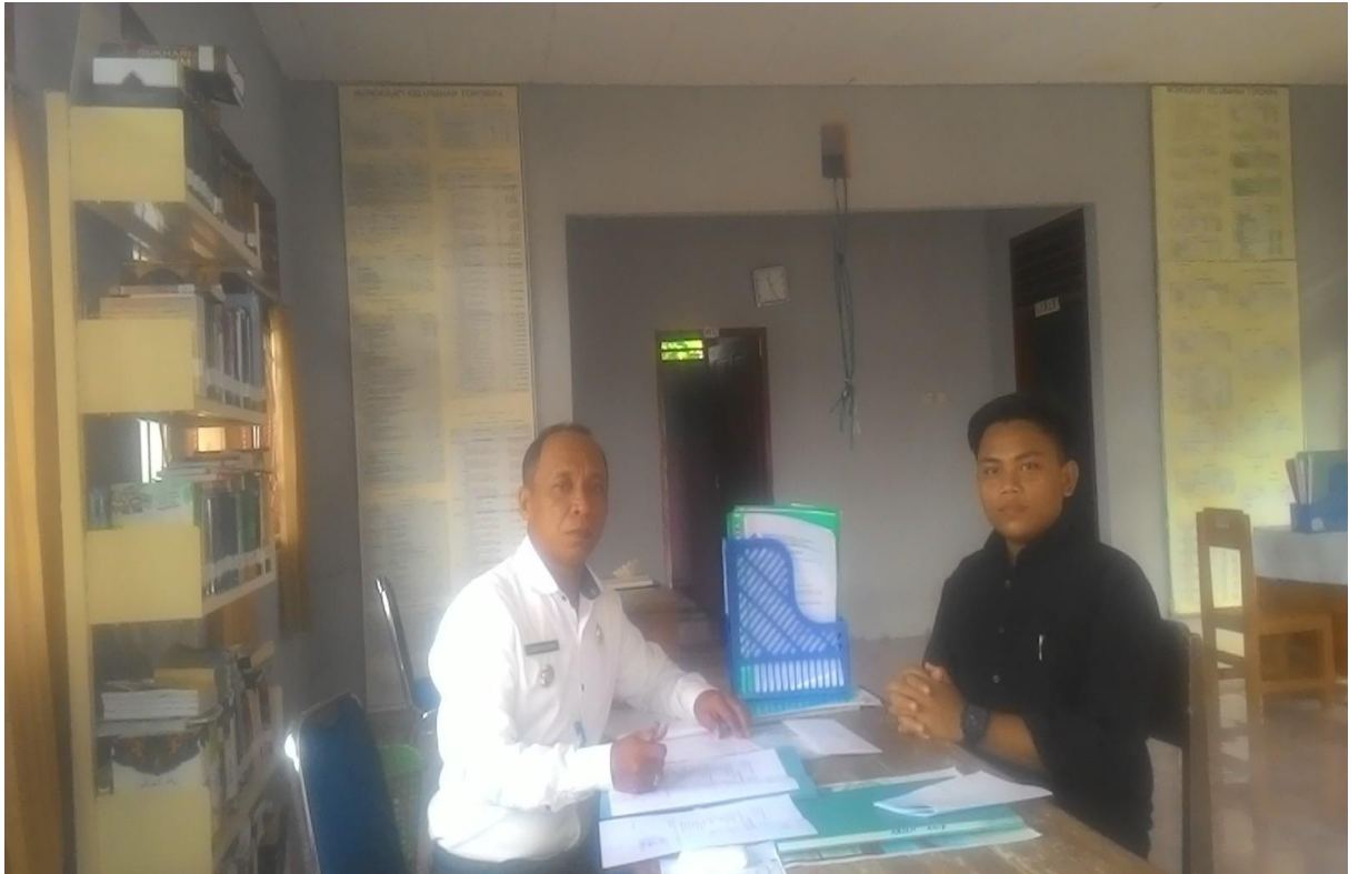
➤ Wawancara dengan Kepala Kelurahan Toronipa