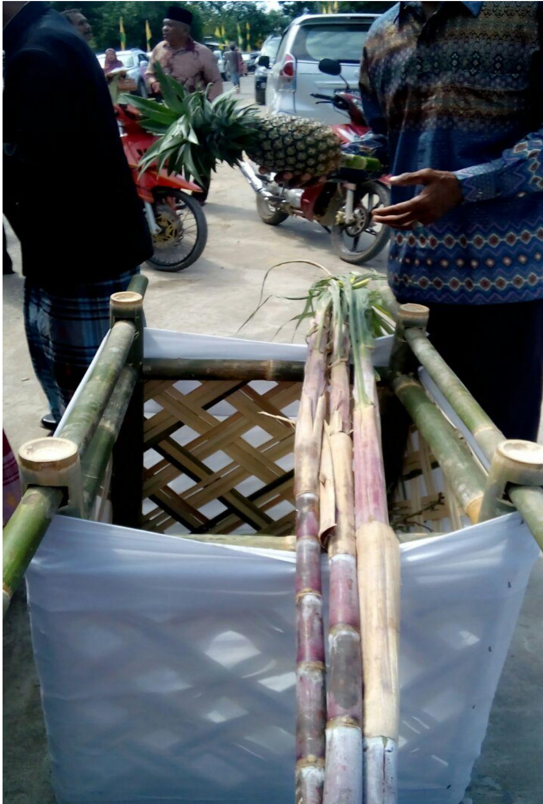
➤ Pappenre' Bua-Buah atau hantaran Buah-buahan dari calon mempelai laki-laki yang di bawa pada saat Mappenre Botting .