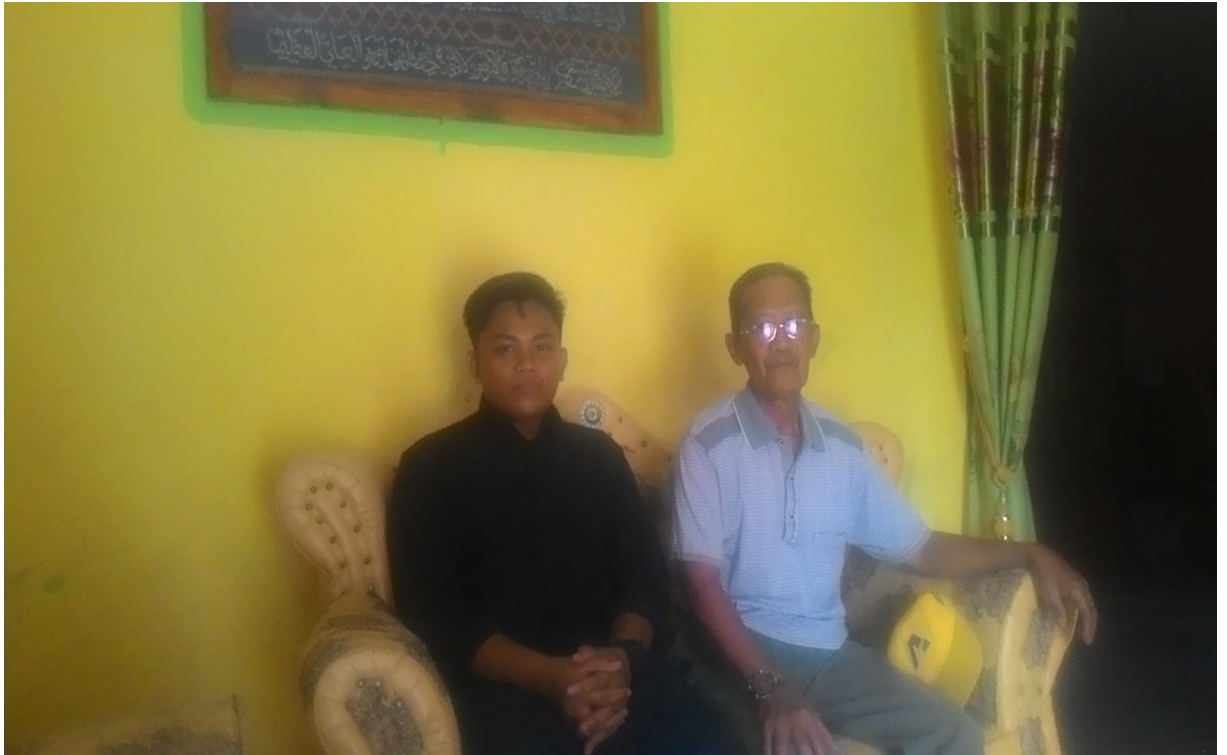
➤ Wawancara dengan Tokoh Masyarakat Kelurahan Toronipa