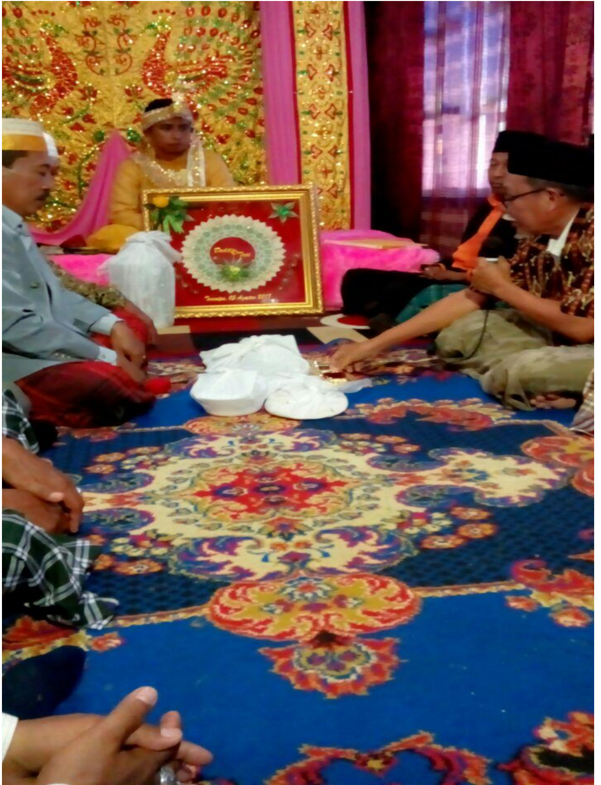
➤ Prosesi penyerahan mahar