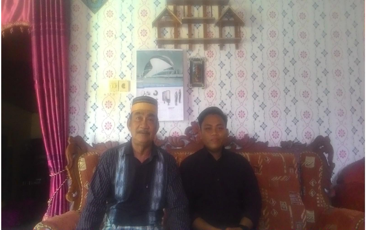
➤ Wawancara dengan Tokoh Adat Kelurahan Toronipa