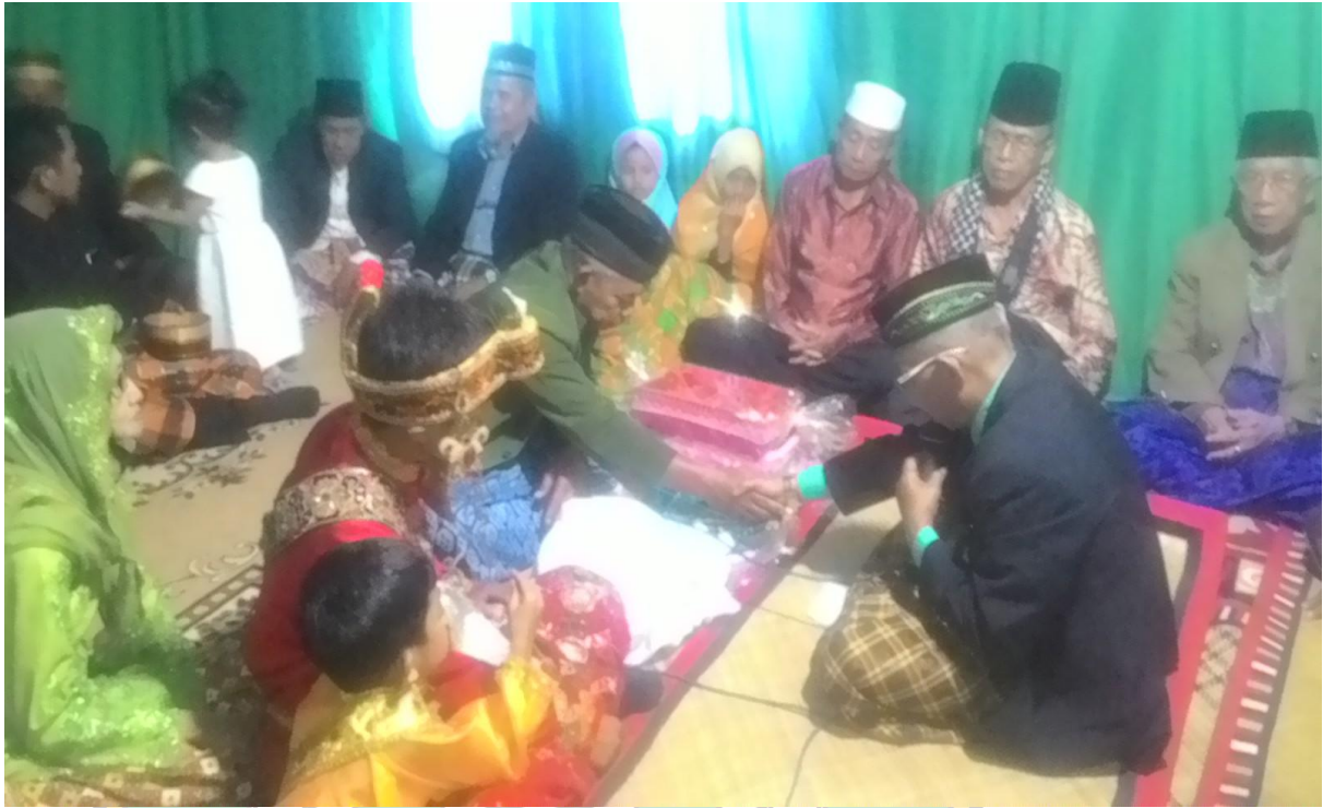
➤ Prosesi penyerahan Perwalian