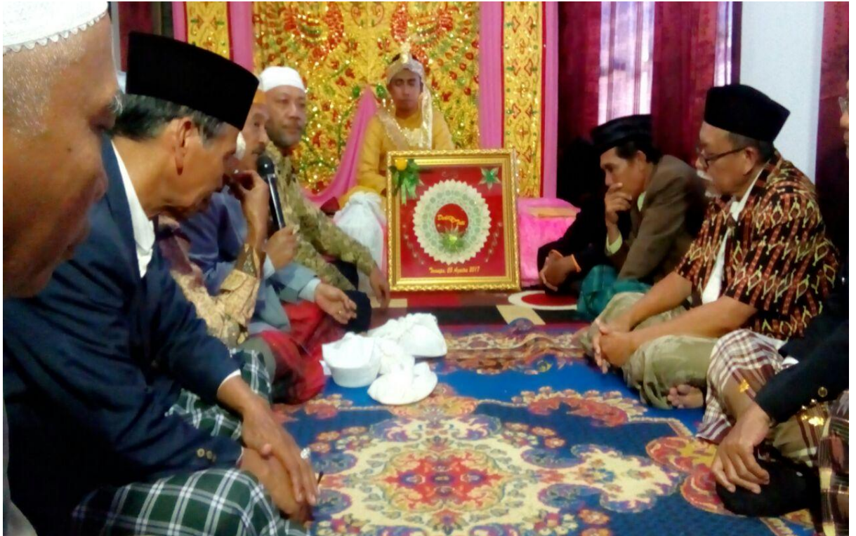
➤ Prosesi penyerahan dan penerimaan Mahar oleh keluarga kedua mempelai