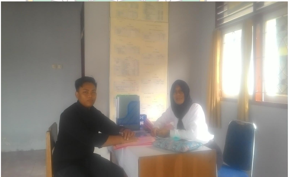
➤ Wawancara dengan Kasi Pemerintahan Kelurahan Toronipa