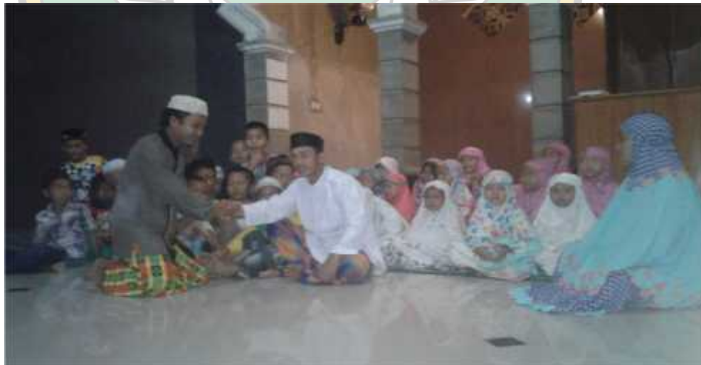
Berdiskusi dengan Responden