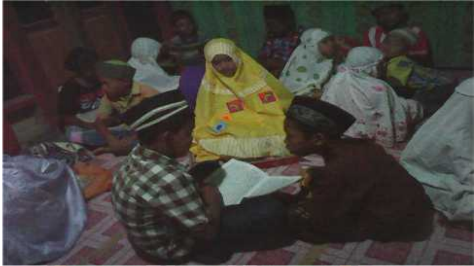
Kegiatan rutin di TPO (Membaca al-Qur'an)