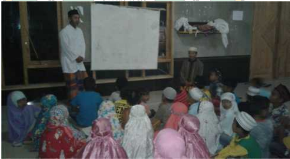
Ustadz Menyampaikan Materi