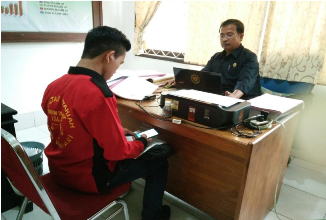
Wawancara pada tanggal 01 Agustus 2017