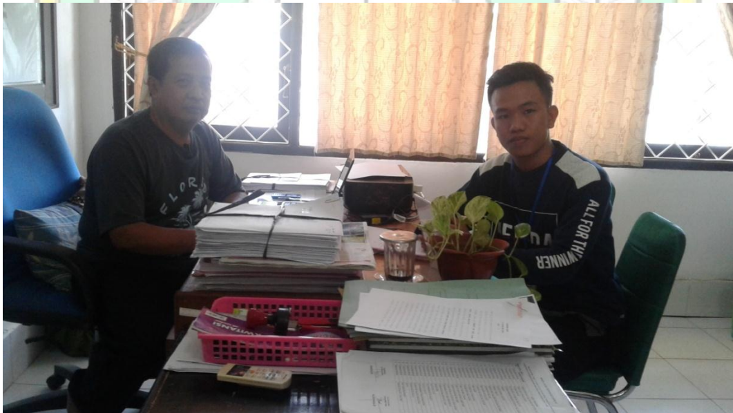
Wawancara pada tanggal 28 September 2017