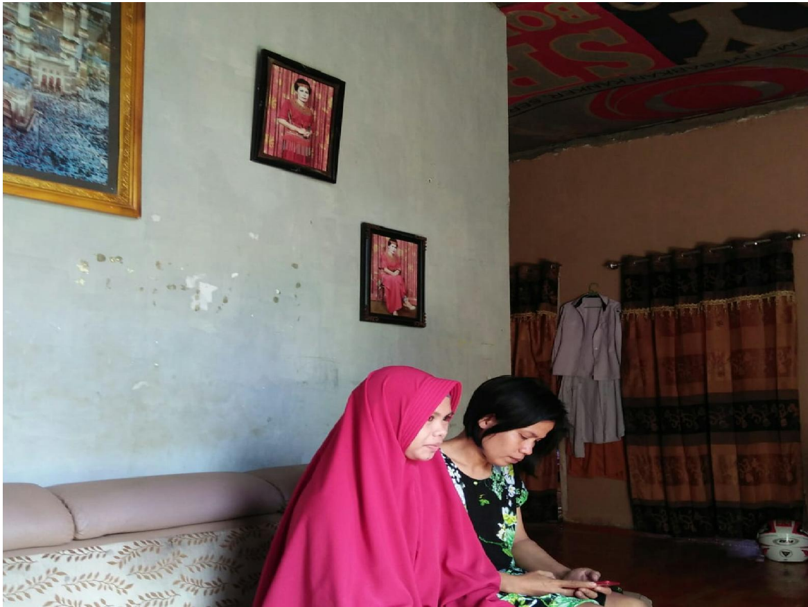
Dok. II wawancara dgn ibu lince