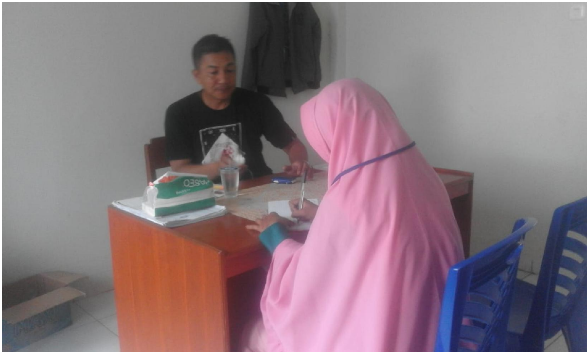
Dok. I Wawancara dengan Kepala Pasar