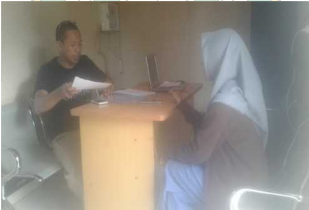
Wawancara dengan HRD PT. Jagad Raya Tamah