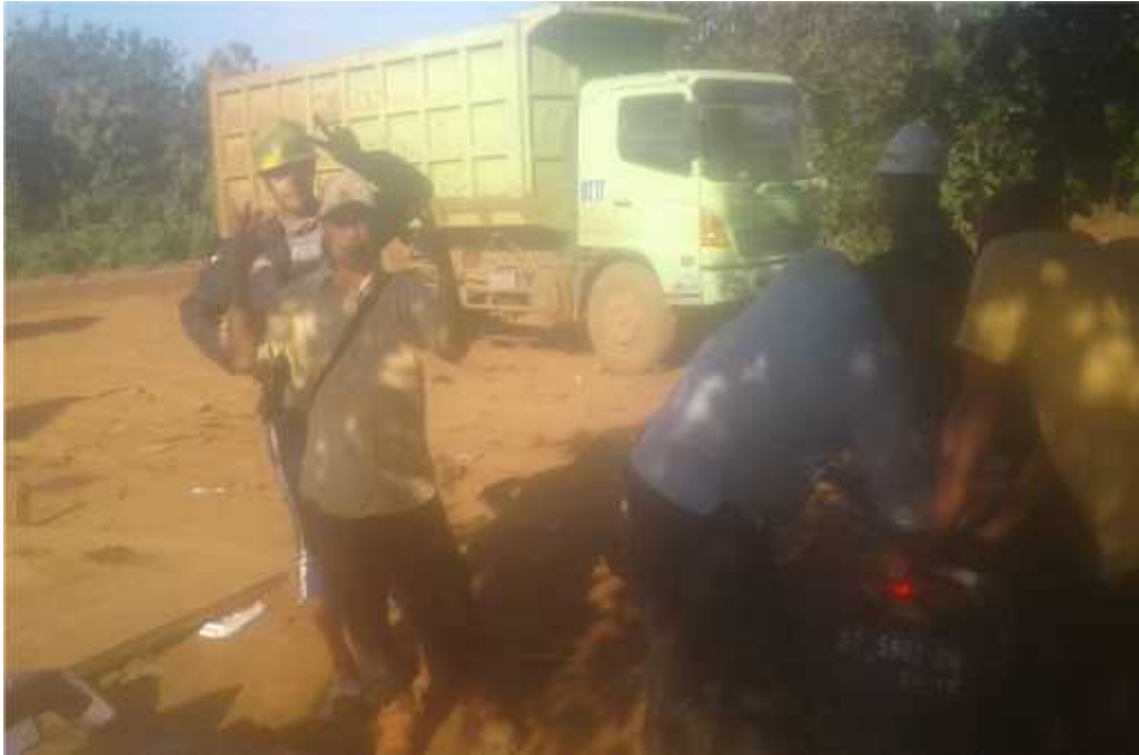
Usai wawancara dengan karyawan PT. Jagad Raya Tamah