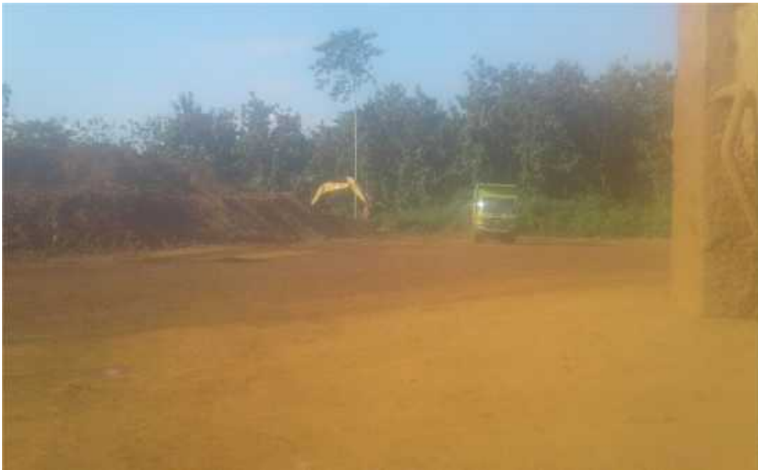
Proses pengangkutan ore (nikel)