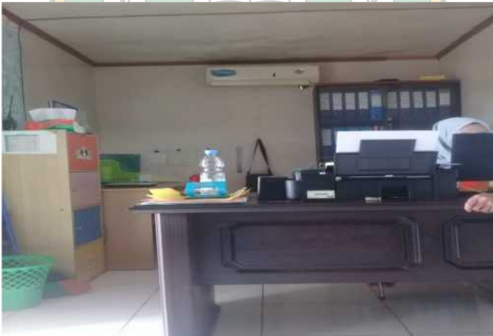
Ruang kerja bagian administrasi PT. Jagad Raya Tamah