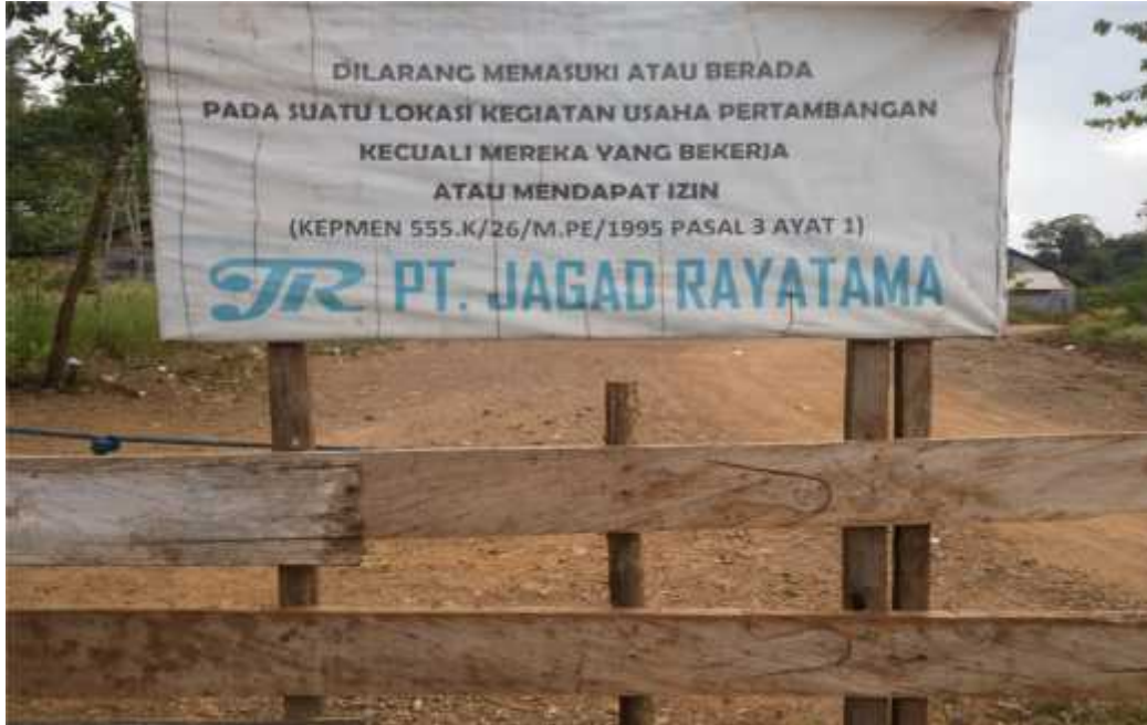
Papan nama PT. Jagad Raya Tamah