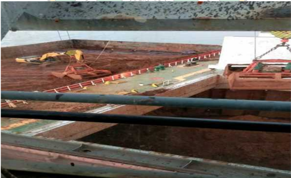
Proses pemindahan ore (nikel) ke kapal