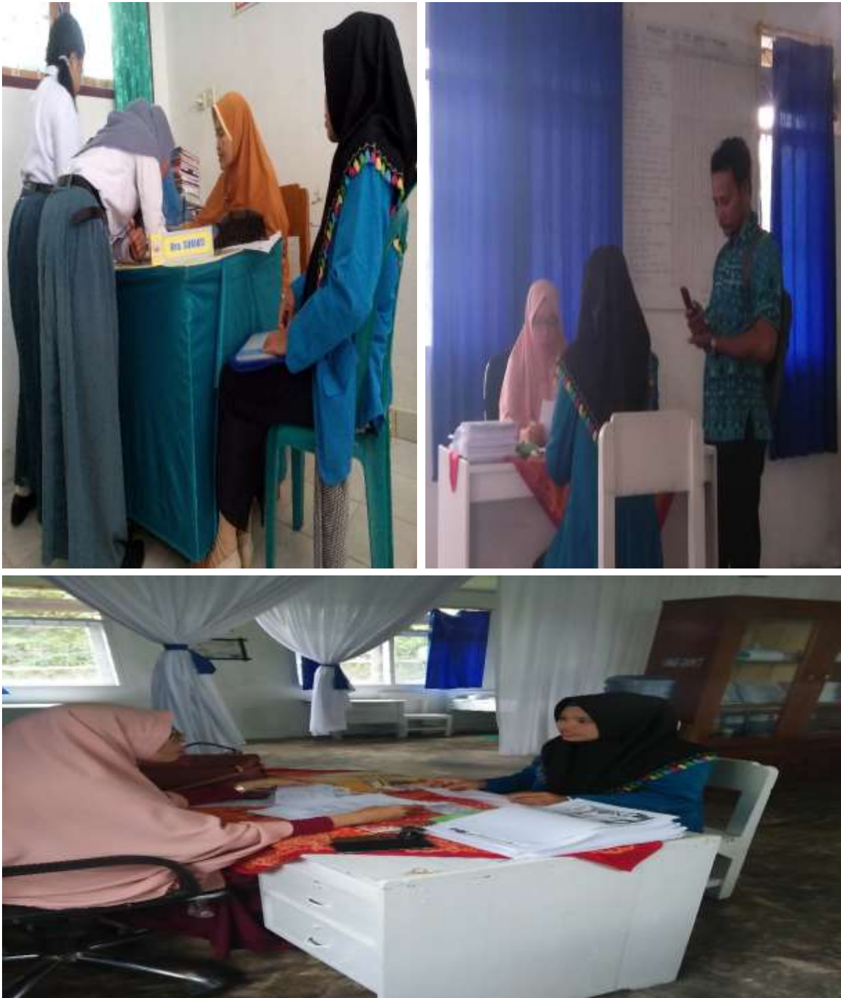
Wawancara bersama Guru BK di SMA Negeri 5 Kendari Tanggal 26 Juli 2018