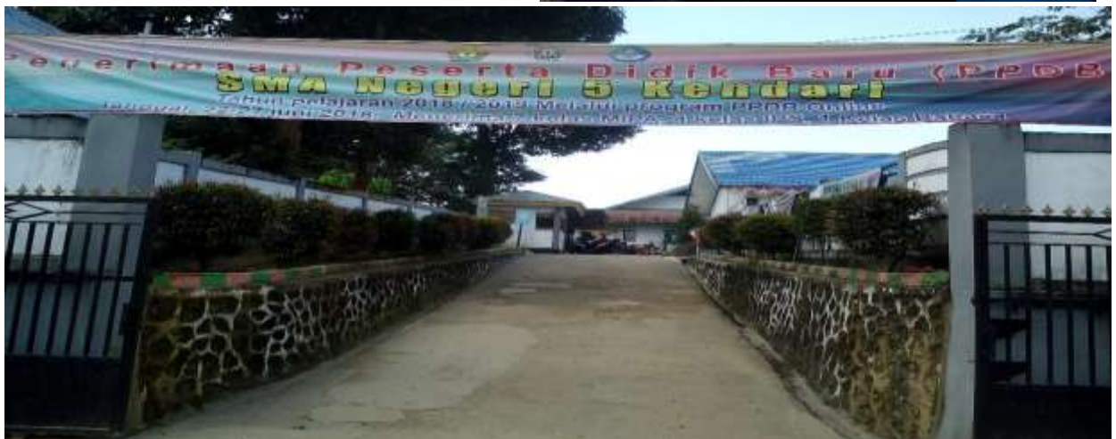
Wawancara bersama Guru BK di SMA Negeri 5 Kendari Tanggal 26 Juli 2018