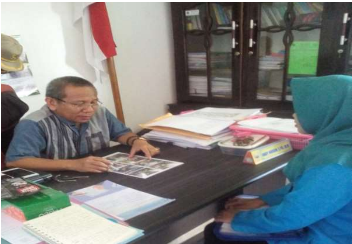
Wawancara bersama Kepala Sekolah SMA Negeri 5 Kendari Tanggal 26 Juli 2018