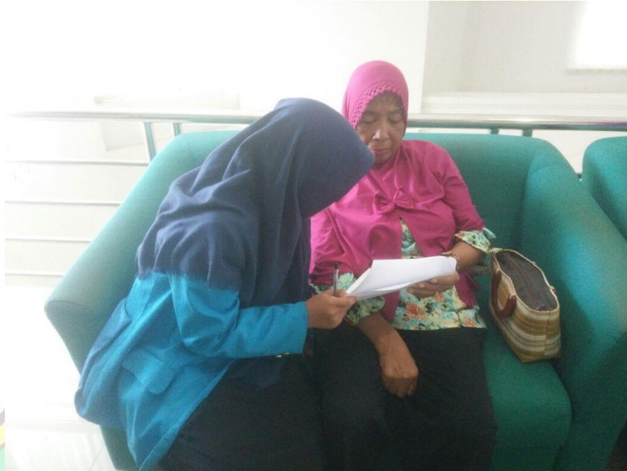
Pengisian Kuisisioner oleh Responden