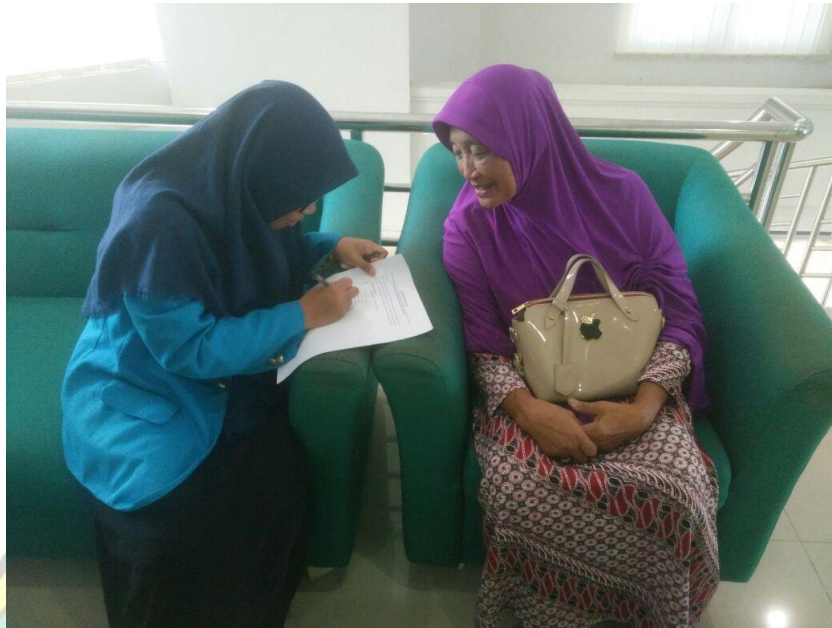
Pengisian Kuisisioner oleh Responden