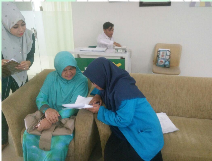
Pengisian Kuisisioner oleh Responden