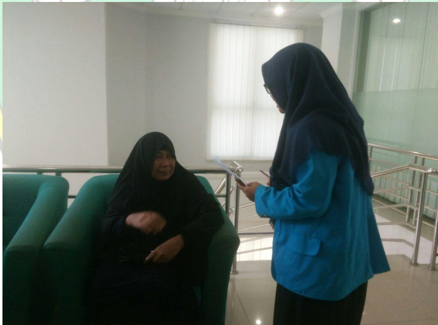
Pengisian Kuisisioner oleh Responden