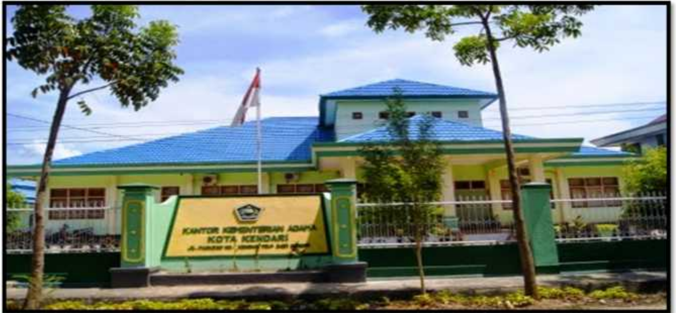
Gambar 1: Gedung BAZNAS Kota Kendari