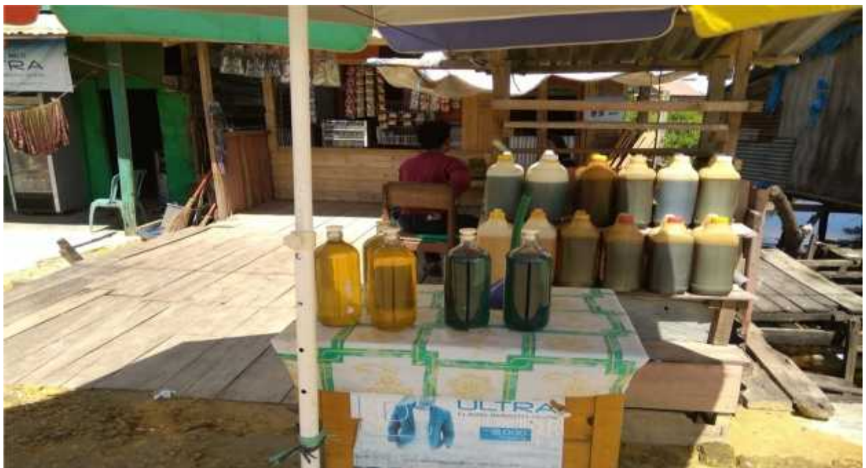
Gambar 9: Usaha mustahiq dalam pemanfaatan dana zakat