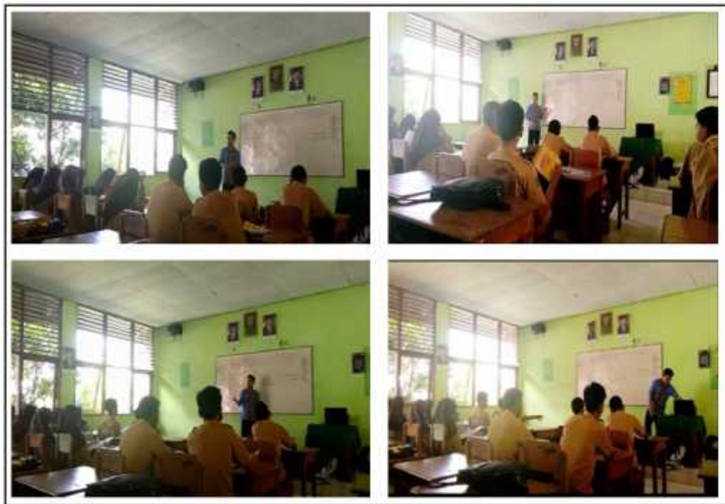
Gambar 3. Kegiatan Guru Menjelaskan Pelajaran