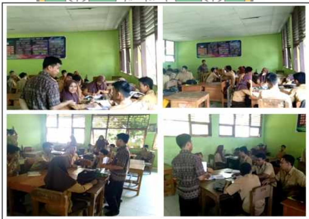
Gambar 4. Kegiatan Guru Membimbing Siswa Saat Berdiskusi