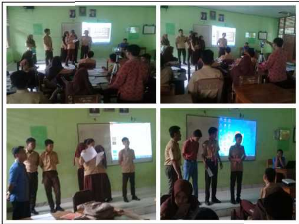
Gambar.9 Kegiatan Presentasi Siswa Di Depan Kelas