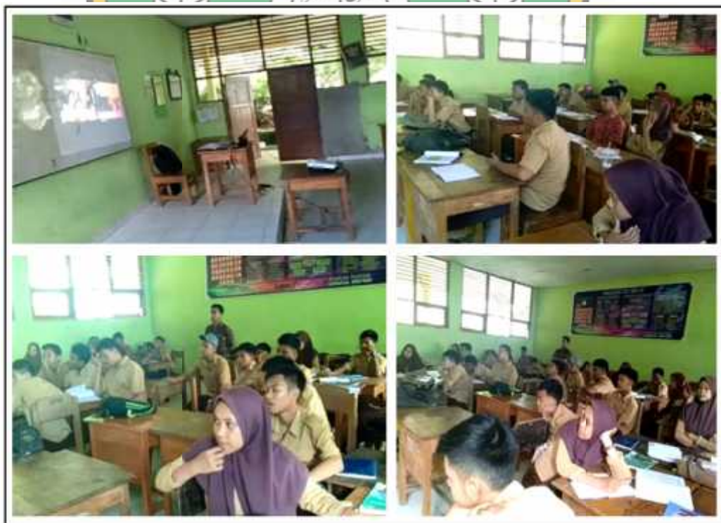
Gambar.6 Kegiatan Siswa Mengamati Tayangan Video