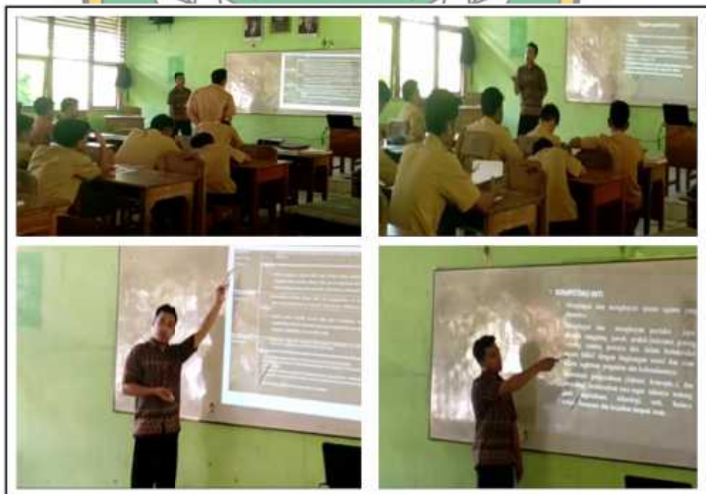
Gambar 2. Kegiatan Guru Menyampaikan Tujuan Pelajaran