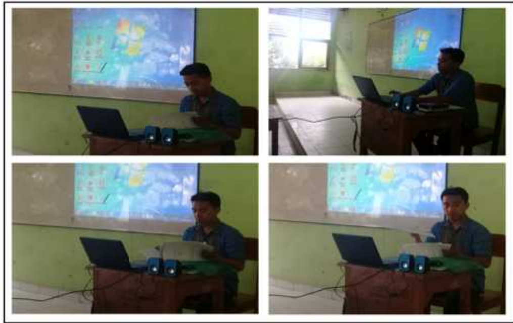
Gambar 1. Kegiatan Guru Membuka Pelajaran