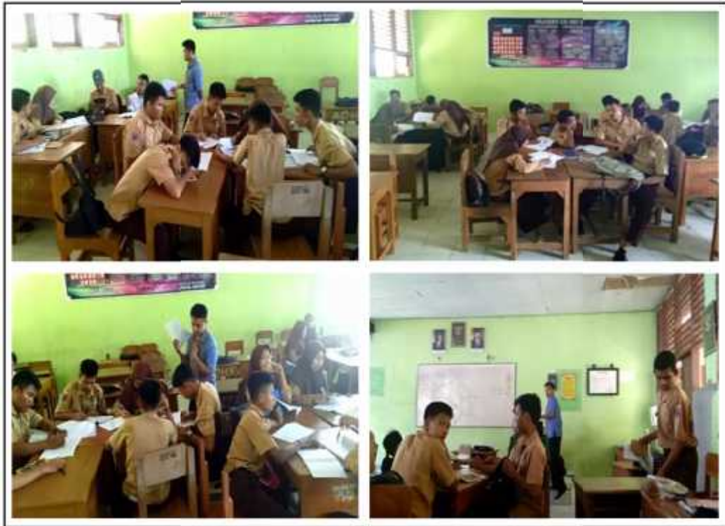
Gambar. 7 Kegiatan Guru Saat Membimbing Diskusi Kelompok