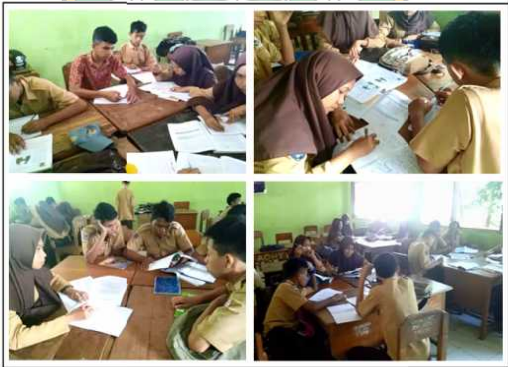
Gambar.8 Kegiatan Siswa Mengerjakan LKS