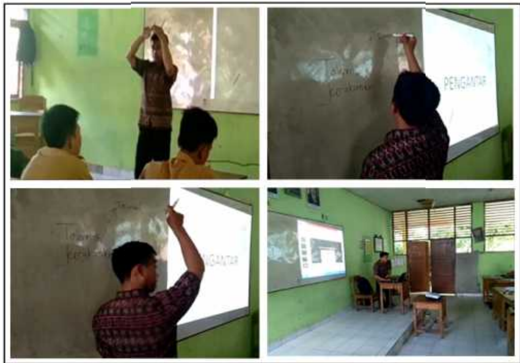
Gambar.5 Kegiatan Guru Memberikan Apersepsi Tentang Materi Pelajaran