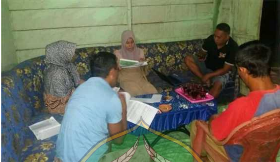
Wawancara dengan bendahara koperasi pondok pesantren mengenai data anggota yang telah menyimpan dana.