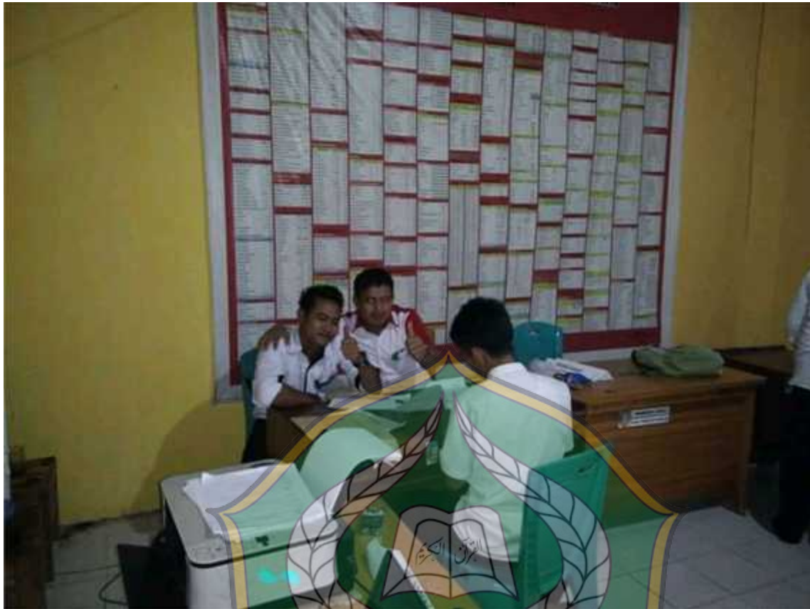
Wawancara dengan pengurus koperasi dan melihat data yang terkait pinjaman