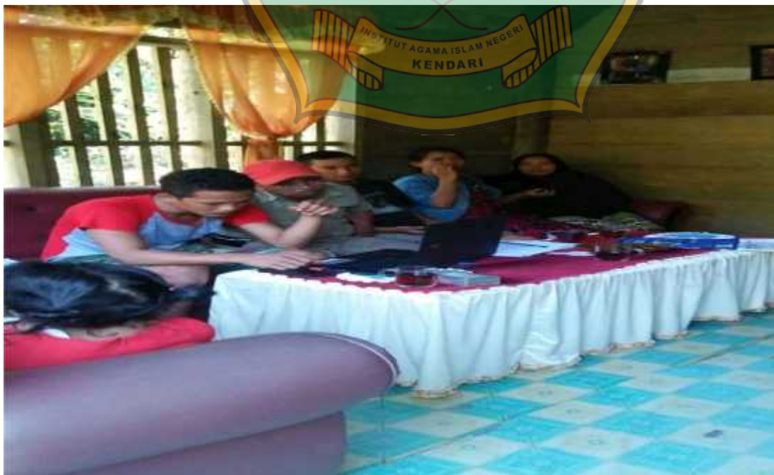
Dokumentasi bersama masyarakat yang telah meminjam