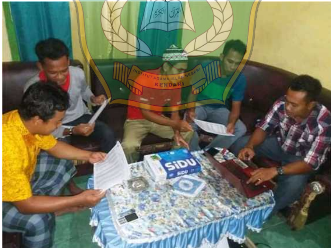
Dokumentasi bersama calon anggota koperasi