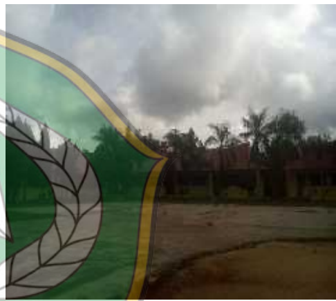
Foto Lapangan Volly Ball