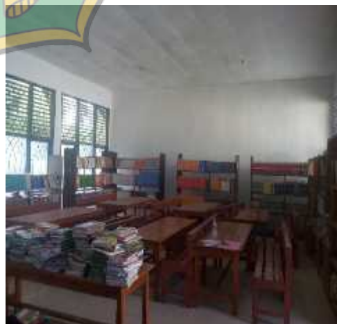
Foto Keadaan Perpustakaan