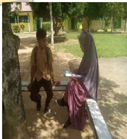
Foto Wawancara siswa