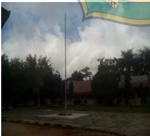
Foto Lapangan Upacara SMAN 10 Konsel