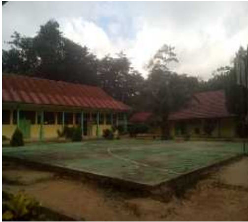
Foto Lapangan Basket SMAN 10 Konsel Konsel