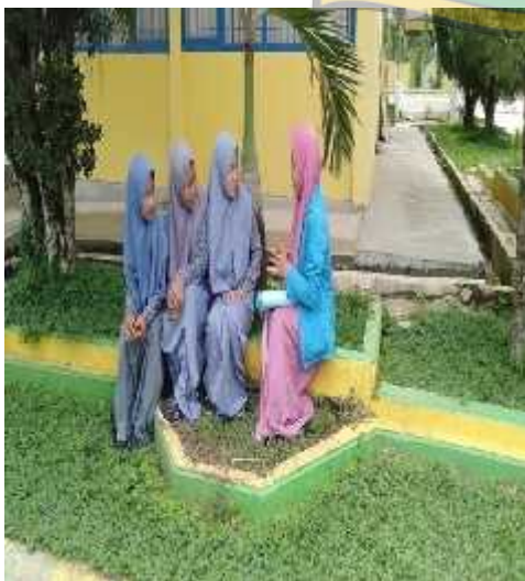
Foto Wawancara siswi SMAN 10 Konsel SMAN 10 Konsel