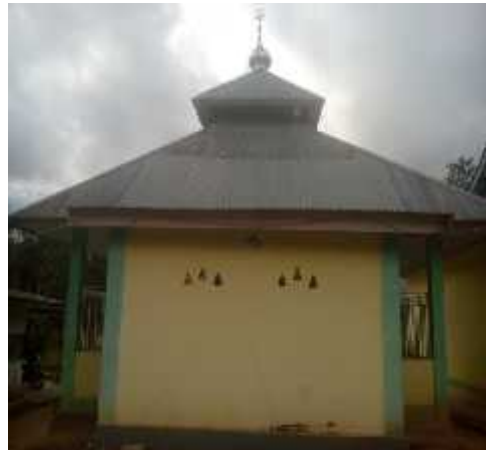
Foto Masjid SMAN 10