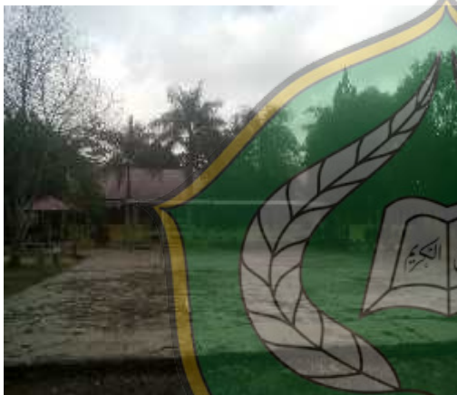
Foto Lapangan Takrow