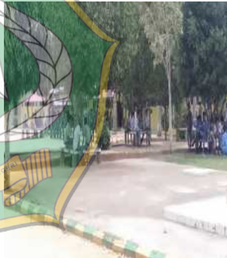
Foto Keadaan SMAN 10