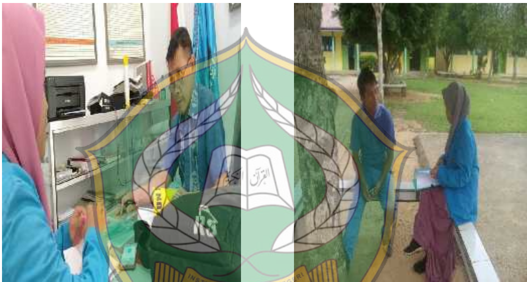
Foto Wawancara Bapak Liy/Kepala Sekolah foto Wawancara Bapak Irsandi/Guru