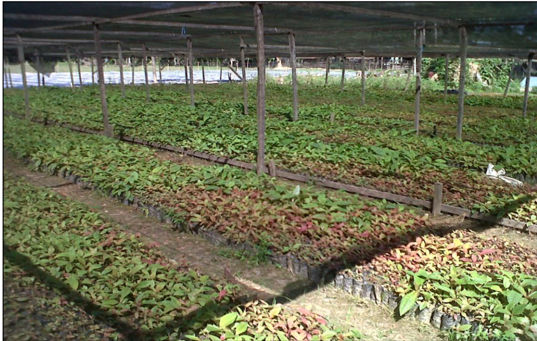
KAYU SITAAN DINAS KEHUTANAN