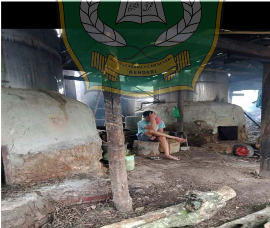
Gambar 6: Pekerja Penyuling Nilam