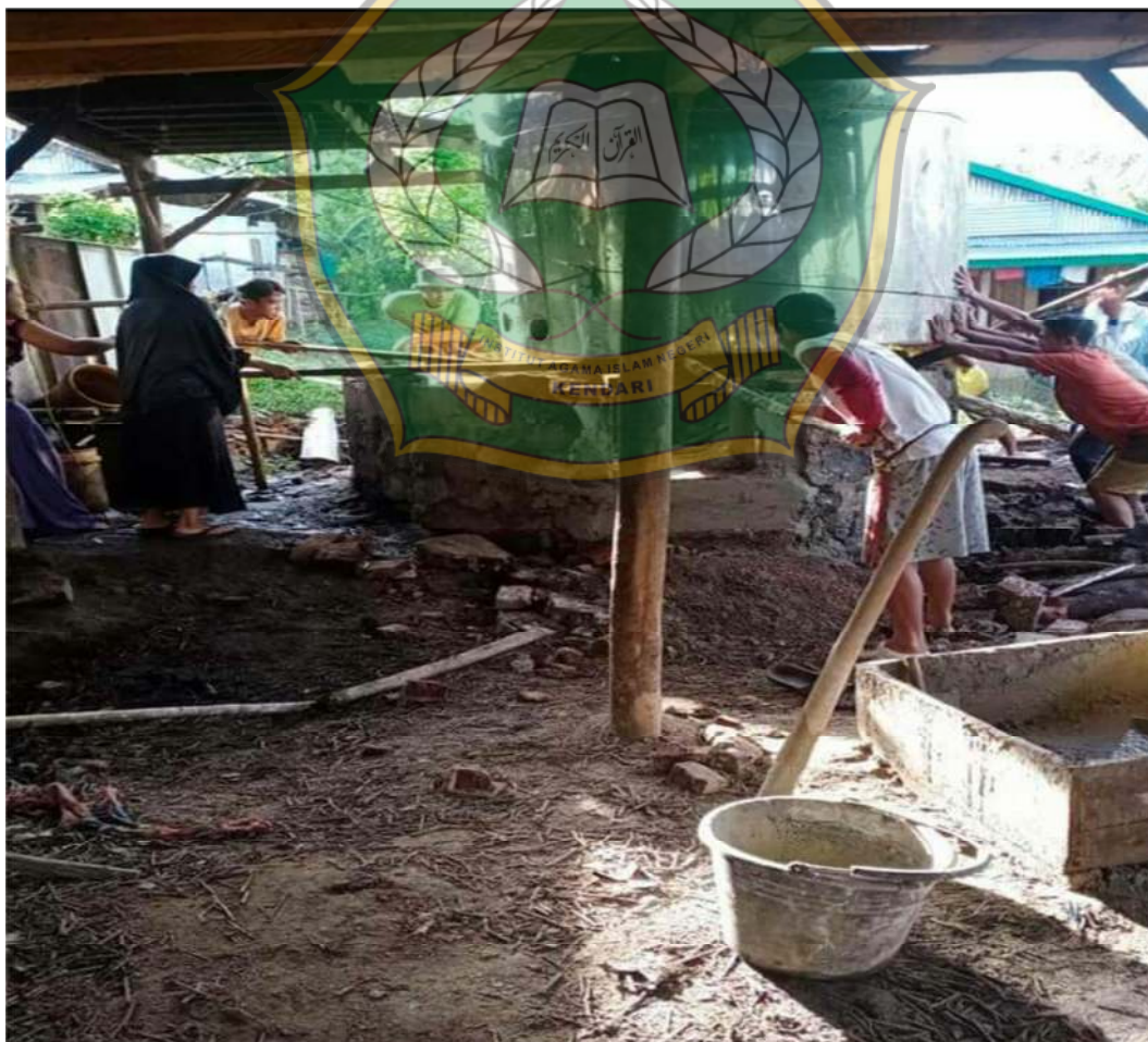
Gambar 4: Proses peletakan ketel penyulingan nilam