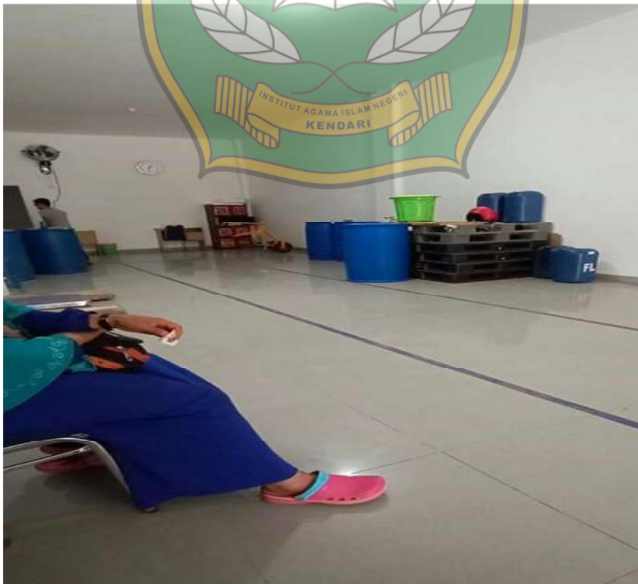
Gambar 8: Tempat Penyimpanan Minyak Nilam