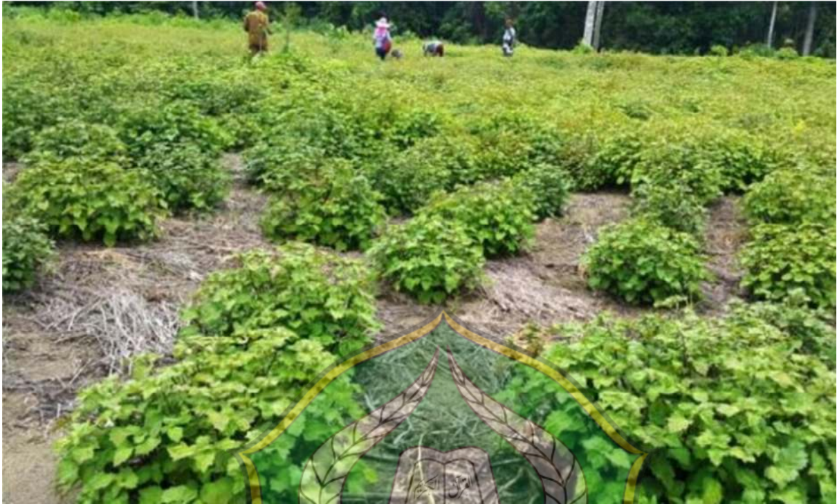
Gambar 1: Tanaman Nilam siap untuk dipanen