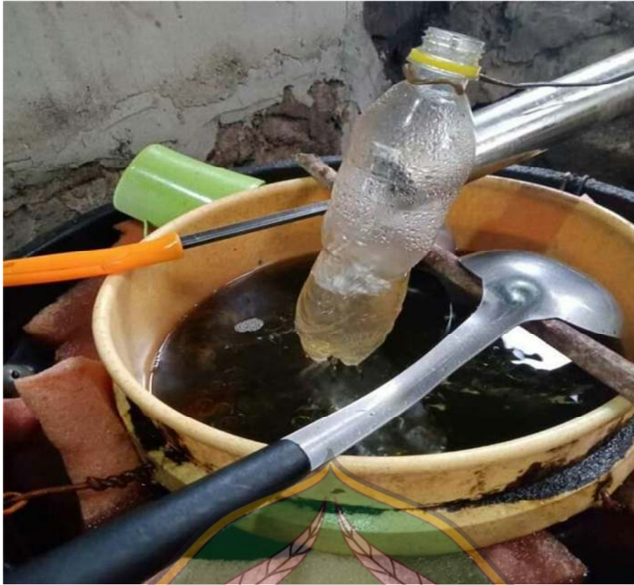
Gambar 7: Proses penyaringan minyak nilam