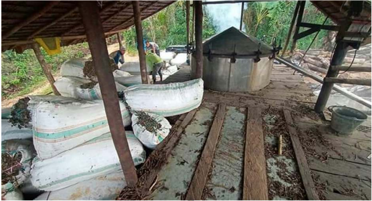
Gambar 3: Tempat Penyulingan Nilam