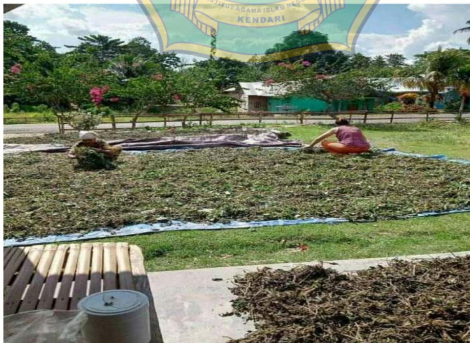
Gambar 2: Proses penjemuran nilam pasca panen