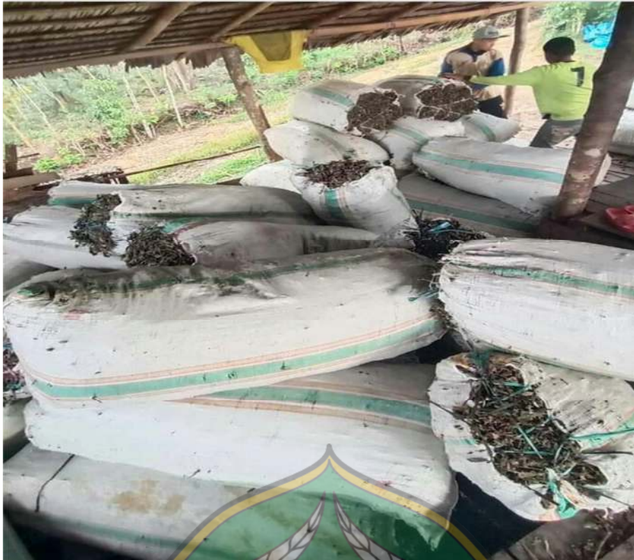
Gambar 5: Proses memasukkan tanaman nilam ke dalam ketel