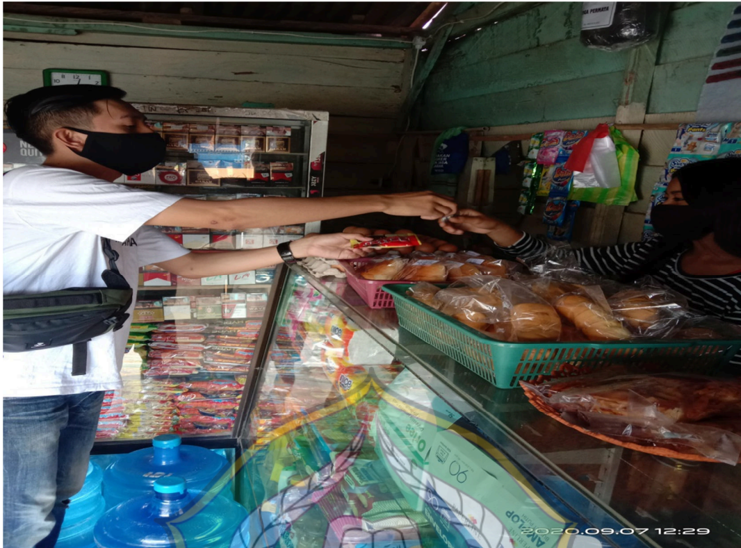
Dokumentasi transaksi menggunakan uang logam dengan nilai 100 dan 200 rupiah di jalan kapten piere tendean pada tanggal 07 September 2020