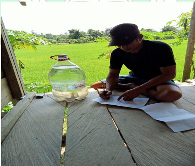
Gambar: 4. Pengisian Kuesioner oleh responden