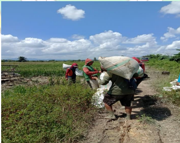
Gambar: 2. Proses pengangkutan bibit ke lahan Pertani