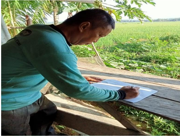
Gambar: 3. Pengisian Kuesioner oleh responden