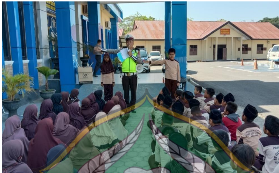
Gambar 1.7 Kegiatan Bersama Gerakan Indonesia Mengajar dan Polres Konawe