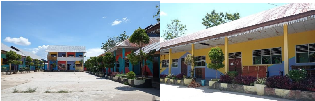
Gambar 1.5 Tampak Halaman depan kelas SDIT Asy Syamil Konawe