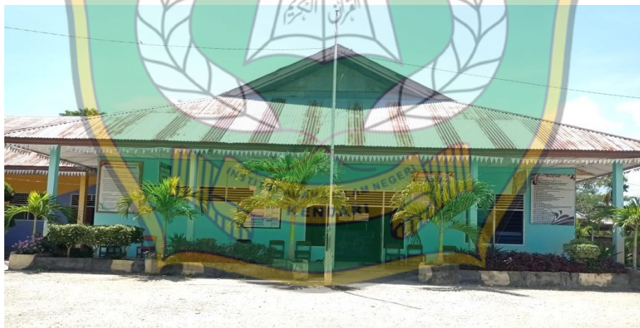
Gambar 1.3 Ruang Guru dan Kepala Sekolah SDIT Asy Syamil Konawe