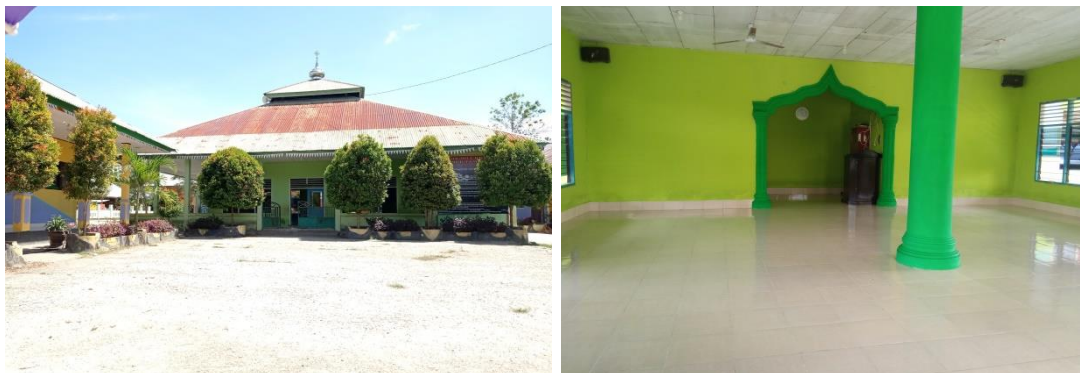
Gambar 1.4 Mushollah SDIT Asy Syamil Konawe