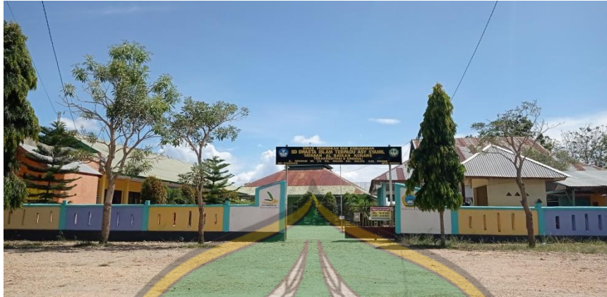
Gambar 1.2 Tampak Depan Gerbang Utama SDIT Asy Syamil Konawe