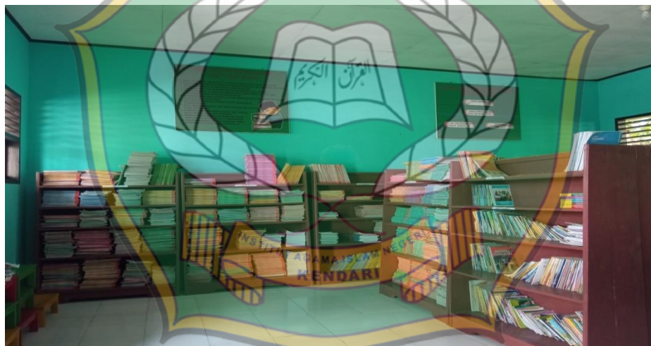
Gambar 1.6 Perpustakaan SDIT Asy Syamil Konawe