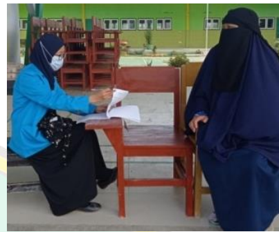
Wawancara siswa kelas IX