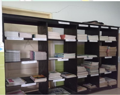
Penyimpanan buku di perpustakaan