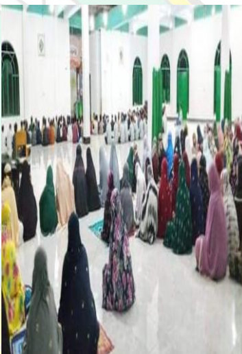
Halaqah Magrib / Taklim