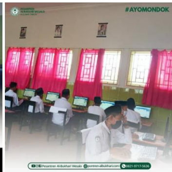
Tes seleksi penerimaan siswa baru

Disukai oleh safararsyad_ dan 35 lainnya pesantren.albukhari.wesalo Alhamdulillah, Ujian Madrasah Berbasis Komputer untuk tingkat MTs di Pesantren Al Bukhari Wesalo yang dimulai pada tanggal 26 Maret 2021 akan berakhir hari ini tepatnya 1 April 2021, semoga para santri mendapatkan nilai yang memuaskan dan semuanya tetap Sehat seperti biasanya,