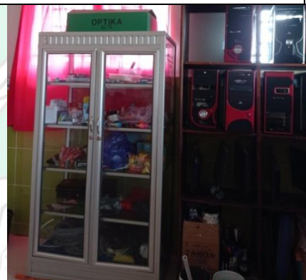
Penyimpanan CPU dan alat Laboratorium IPA