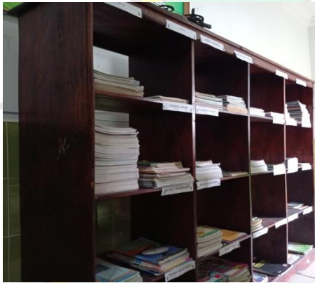
Penyimpanan buku di perpustakaan