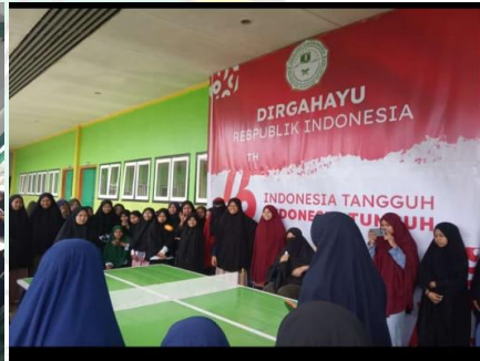
Peringatan 17 agustus 2021