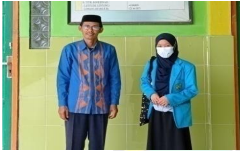
Foto bersama Bapak Kepala Madrasah pasca melakukan Wawancara