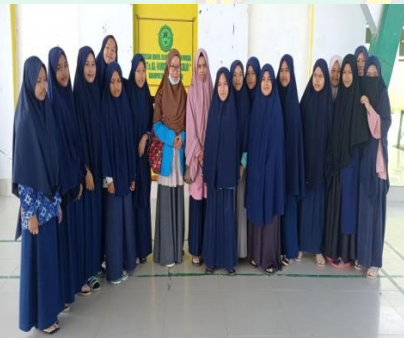
Foto Bersama Ibu Wakil Kepala Madrasah dan Santri MTs