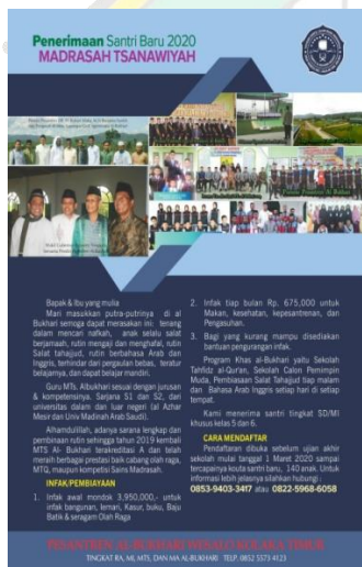
Pamphlet penerimaan siswa baru MTs. Al-Bukhari