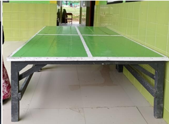
Lapangan Tenis Meja