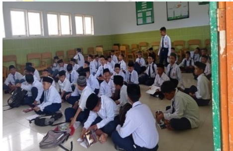
Pembelajaran Bahasa Kelas Putra