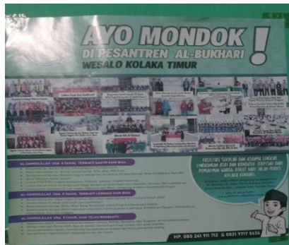
Pamflet Penerimaan Siswa Baru