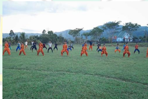
Kegiatan Ekstrakurikuler (Latihan Pencak Silat Tapak Suci)