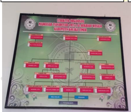
Struktur Organisasi MTs. Al-Bukhari Wesalo