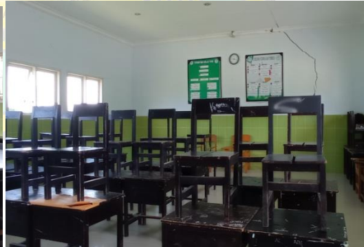
Kondisi Ruang Kelas