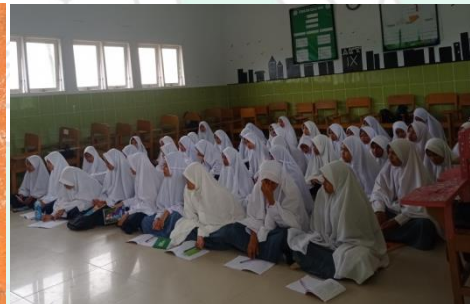
Pembelajaran Bahasa Kelas Putri