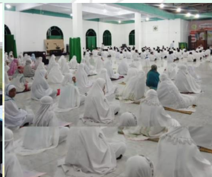
Peringatan 1 Muharram 1443 / 1 Agustus 2021