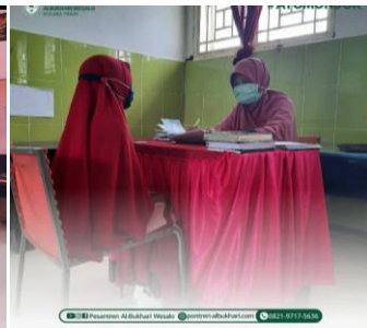
Tes seleksi penerimaan siswa baru

Disukai oleh safararsyad_ dan 25 lainnya pesantren.albukhari.wesalo Alhamdulillah, hari ini telah berlangsung dengan baik Tes Seleksi Penerimaan Santri baru berbasis Komputer dilanjutkan dengan tes wawancara baik untuk tingkat MTs dan MA di Pesantren Al Bukhari Wesalo dan ini masih Gelombang pertama, insyaallah untuk Gelombang berikutnya akan kami infokan lagi. Kami ucapkan terimakasih kepada para orang tua calon santri atas waktunya berkunjung ketempat kami yang insyaallah tidak lama lagi akan resmi menjadi Santri di Pesantren Al Bukhari Wesalo Kolaka timur, 🙏🏻