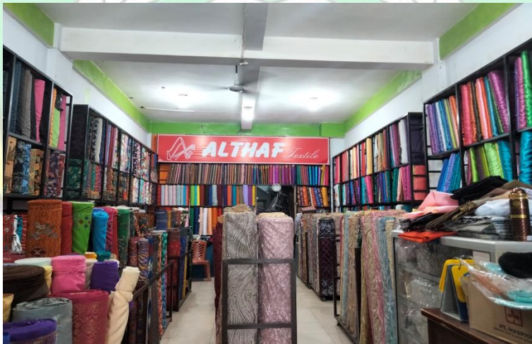
Usaha Butik dan Penjual Kain (seragam dan batik)