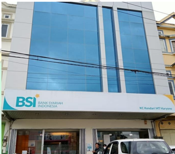
BSI KC Kendari MT Haryono

Melakukan observasi dengan melihat langsung dan mengamati kondisi pada BSI KC Kendari MT Haryono.