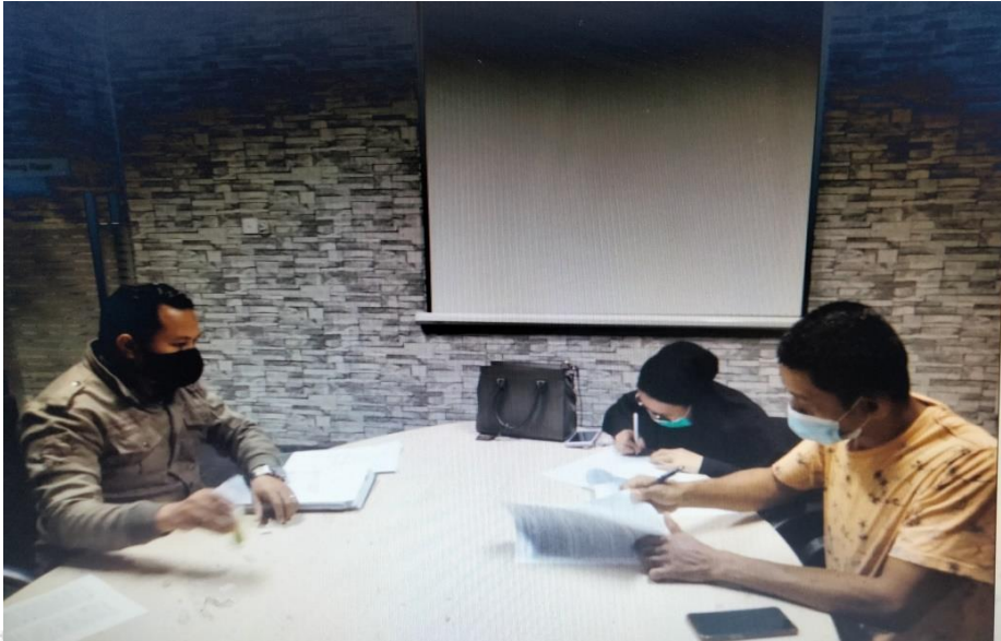
Penandatanganan akad nasabah