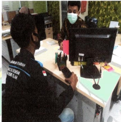
Gambar 1. Wawancara Kepada salah satu pegawai Bank Syariah Indonesia, Tanggal, 8 Oktober 2021