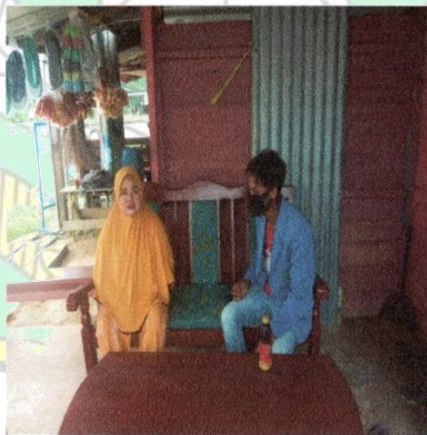
Gambar 2. Wawancara Kepada salah satu nasabah Bank Syariah Indonesia, Tanggal, 8 Oktober 2021