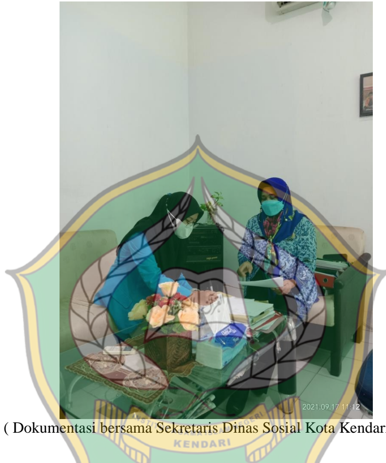
( Dokumentasi bersama Sekretaris Dinas Sosial Kota Kendari)