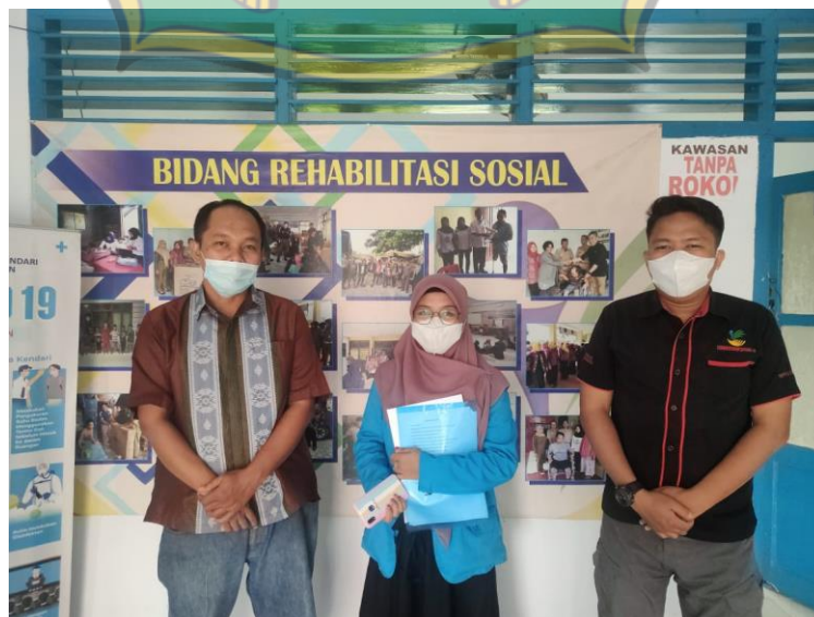
(Dokumentasi bersama Pihak Bidang Rehabilitasi Sosial dan Lanjut usia Dinas Sosial Kota Kendari )