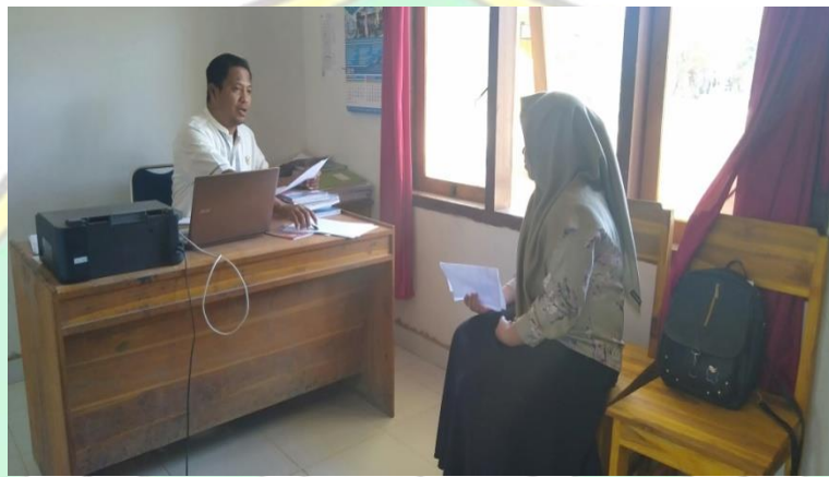
Halaman Sekolah SMAN 17 Konsel Ruang Guru