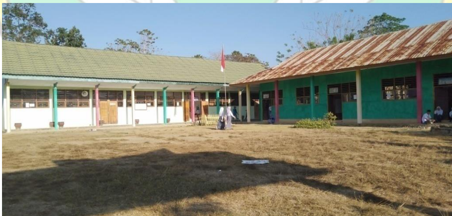
Musholah Mas Al-Amin Labokeo