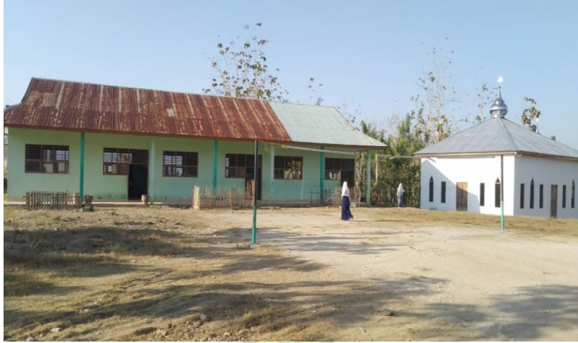
Siswa Mas Al-Amin Labokeo