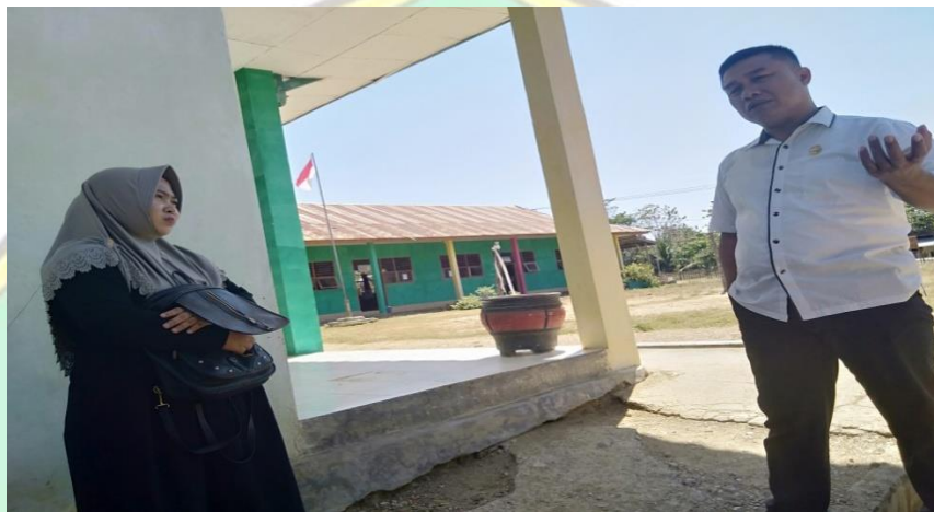
Gedung Sekolah Mas Al-Amin Labokeo