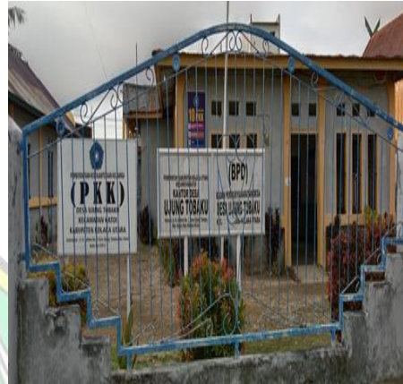
Kantor desa tobaku