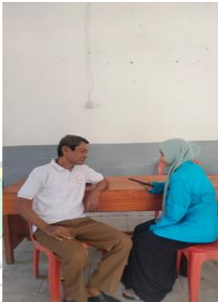
Wawancara bersama dengan kepala desa tobaku