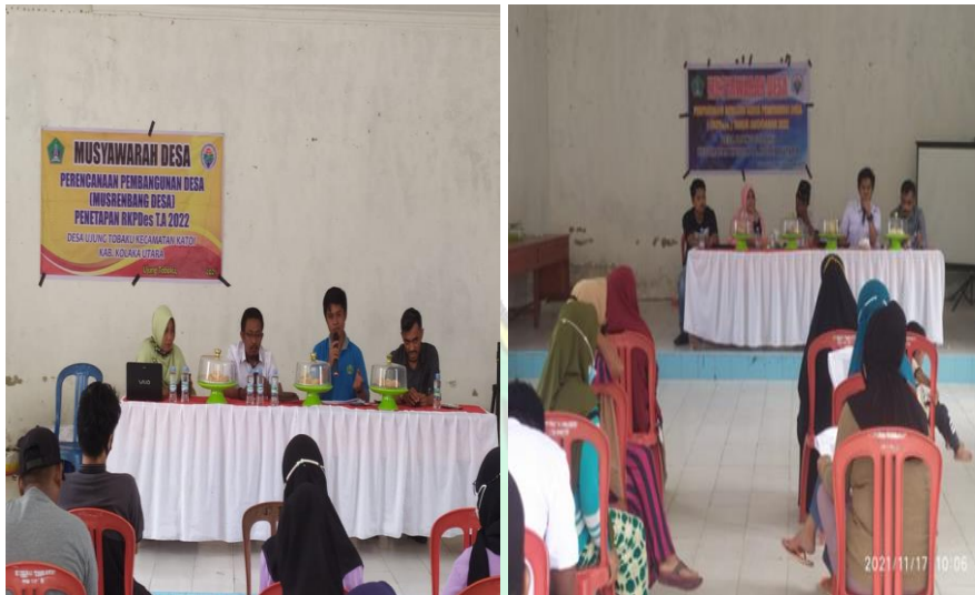
Kegiatan Rapat umum (musyawarah)