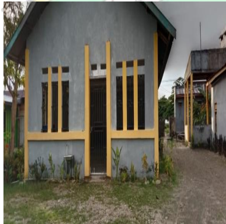
Foto kantor posiandu