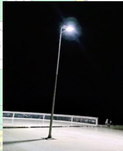
Foto lampu jalan