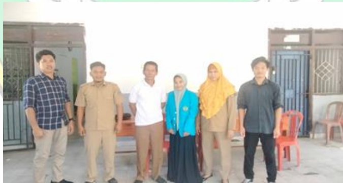
Foto bersama dengan aparat desa tobaku