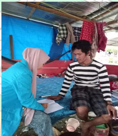
Wawancara kepada warga