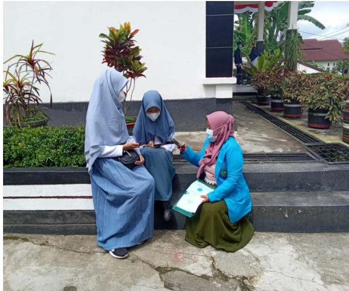
Wawancara dengan siswa kelas XI MIPA