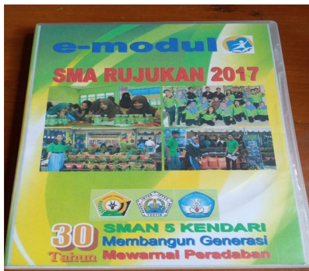
E-modul Sekolah rujukan/Sekolah percontohan pada Tahun 2017