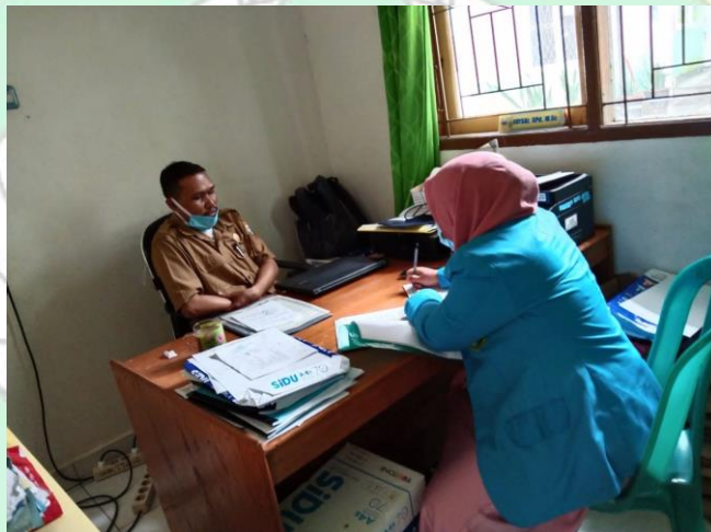
Wawancara bersama guru kurikulum