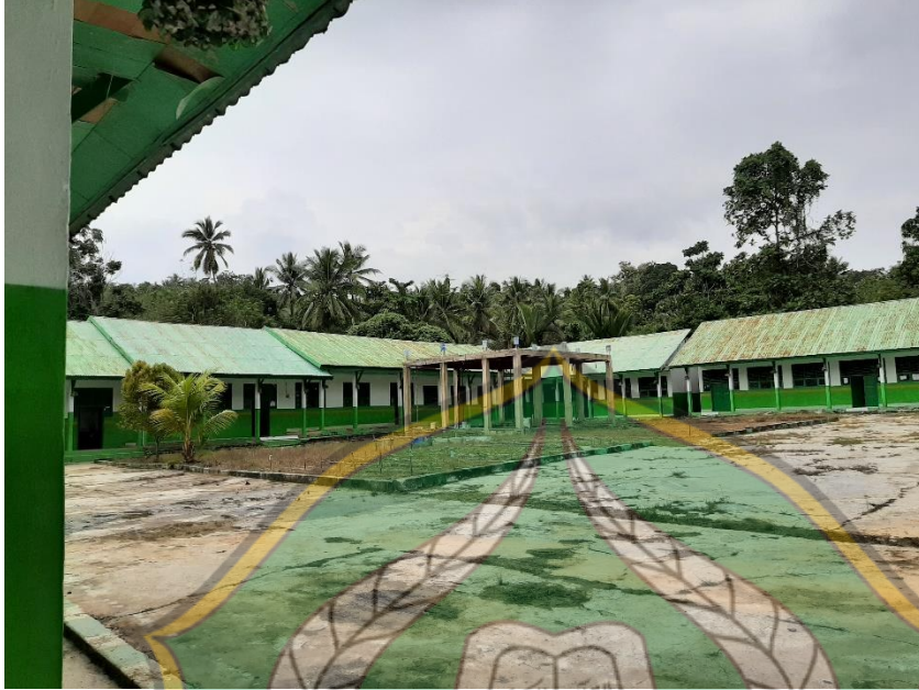
مدرسة ثانوية لموباجو واوليزيا كوناوي الشمالية