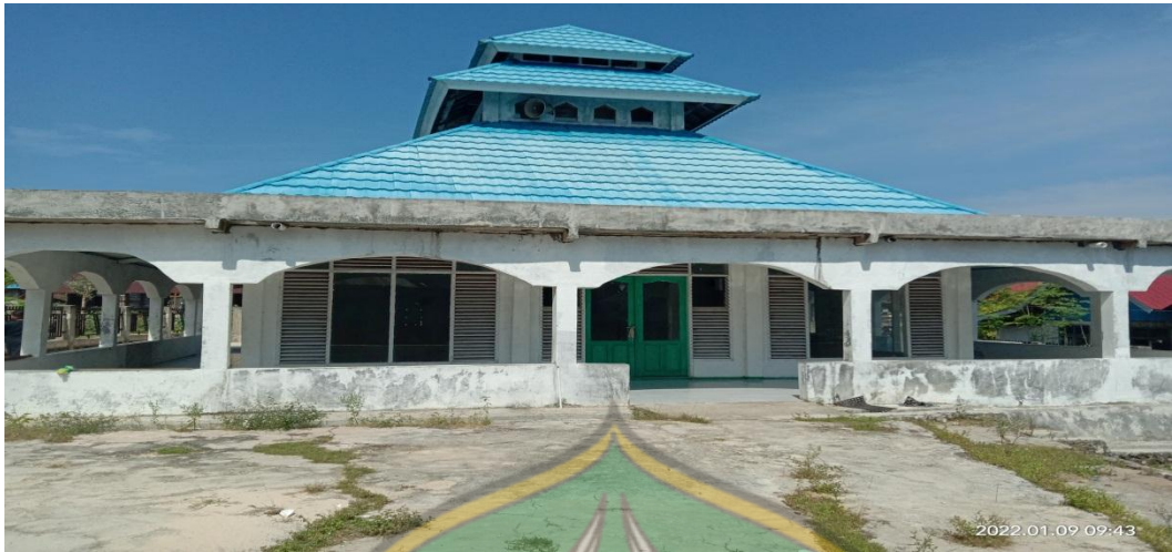
Masjid Nurul Hayyu Desa Lakarama