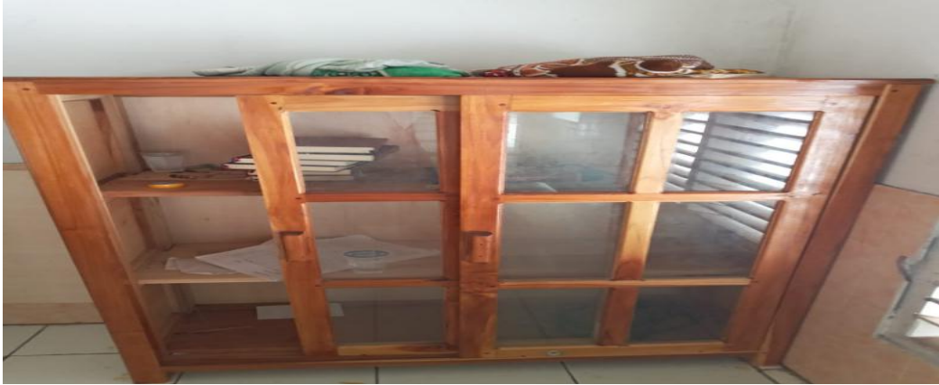
Lemari Tempat Al-Quran