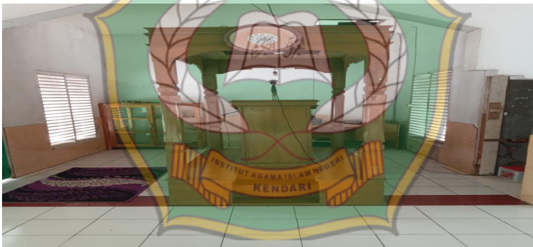
Mimbar Masjid Nurul Hayyu