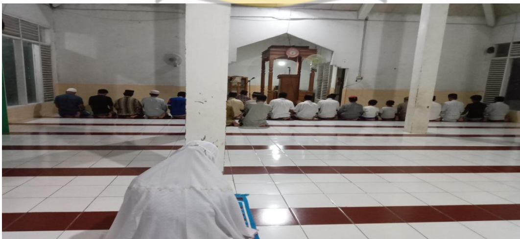
Kegiatan Shalat Isyah Berjamaah