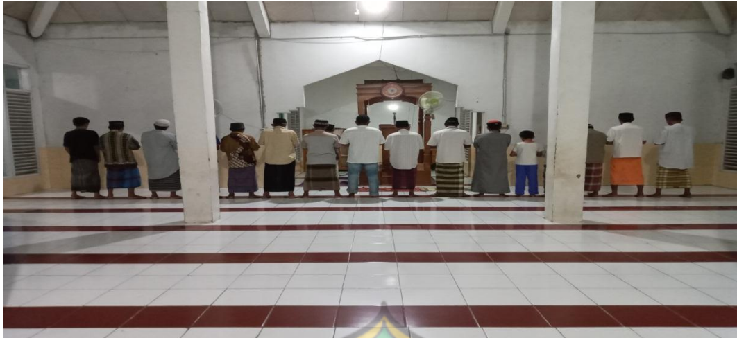
Kegiatan Shalat Magrib Berjamaah