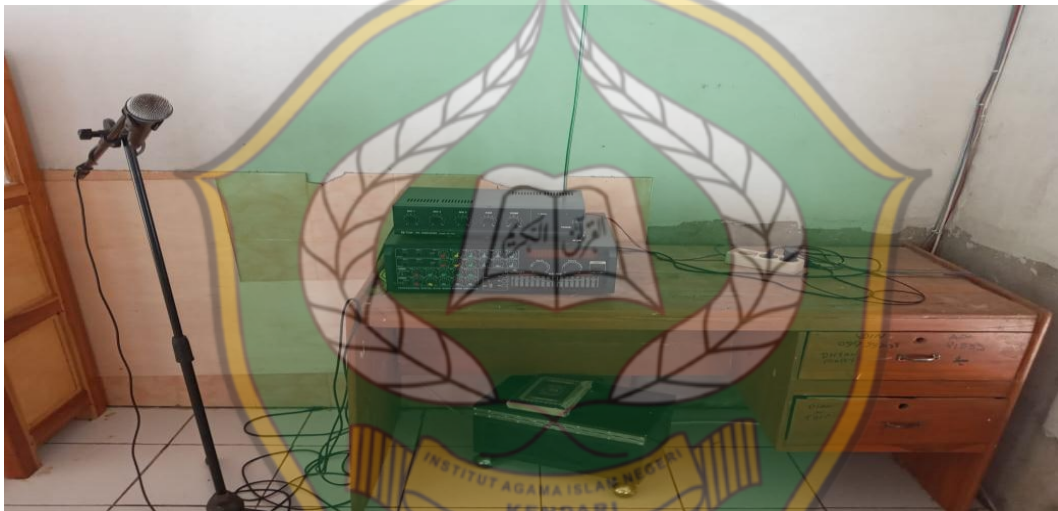
Pengeras Suara Untuk Azan (Mic)