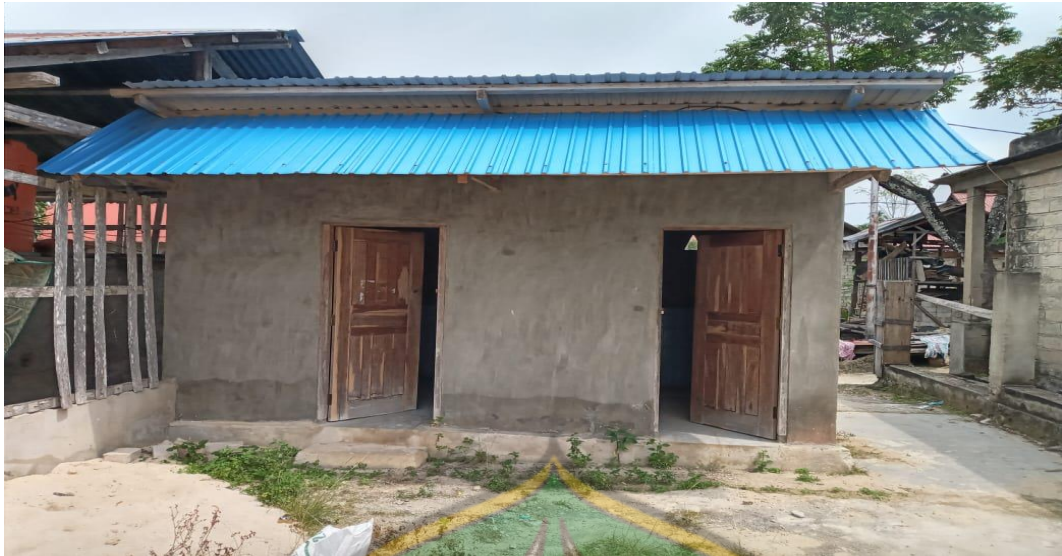
Kamar Mandi Dan WC