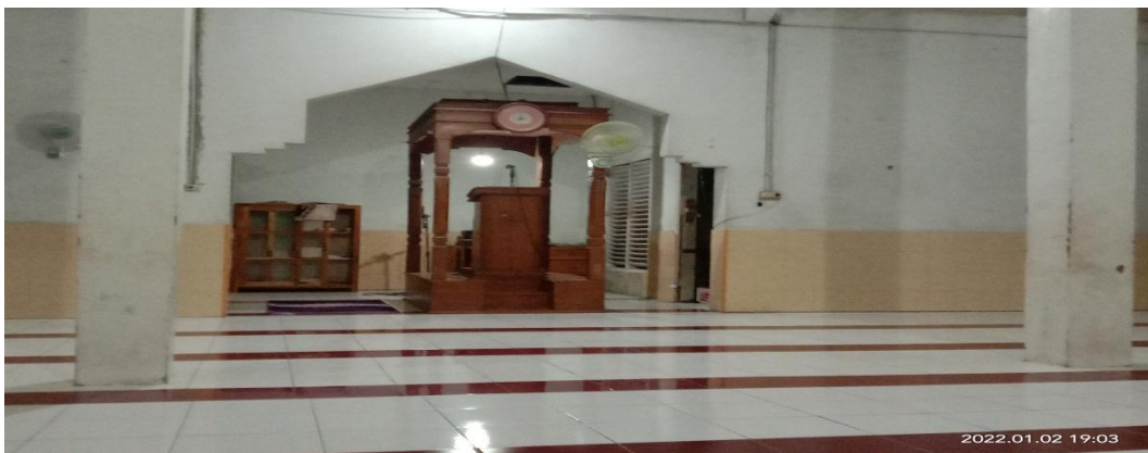
Suasana Dalam Masjid