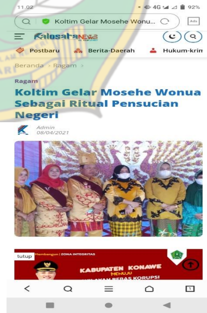
pemberitaan media Kalosara news