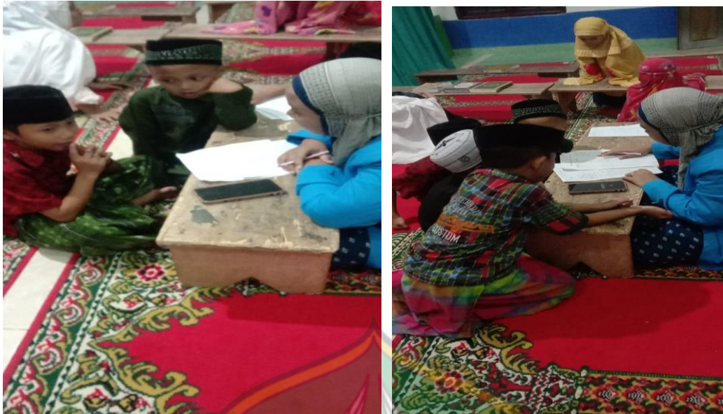
b. Dokumentasi Kegiatan Pembelajaran TPQ Nur Huda