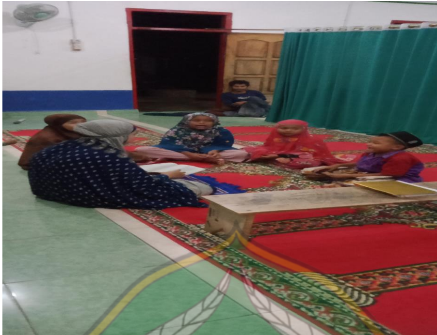
c. Dokumentasi sarana dan Prasarana TPQ Nur huda