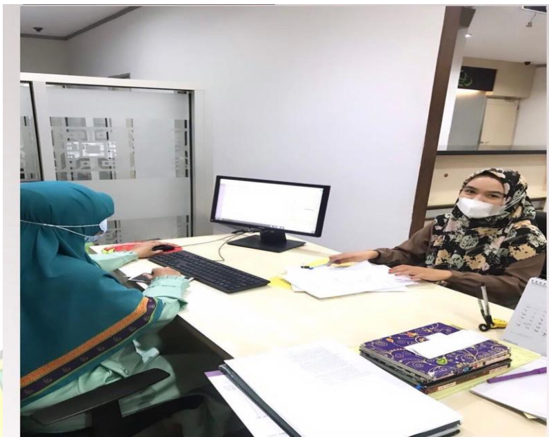
Observasi di Bank Muamlat Cabang Kendari