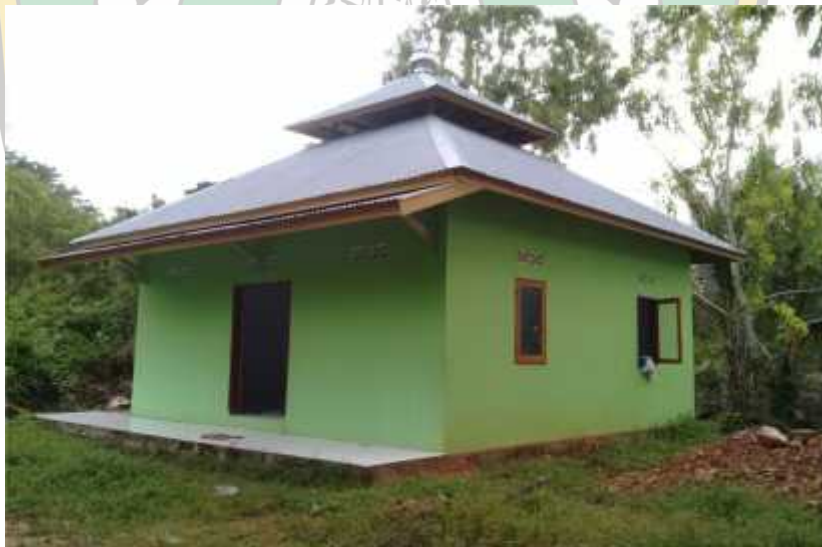
Fasilitas musollah yang terdapat di kawasan obyek wisata pantai Toronipa