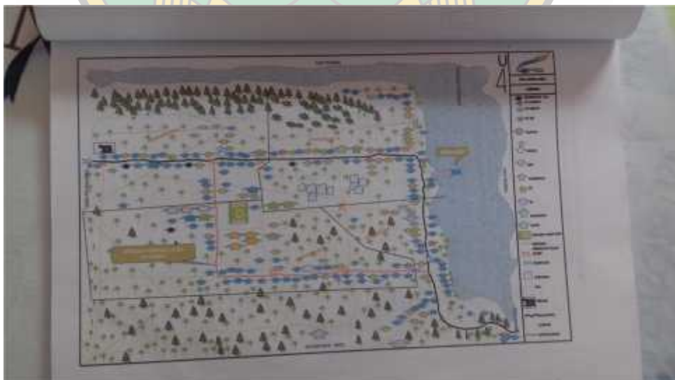
Peta kelurahan Torononipa kecamatan Soropia Kabupaten Konawe