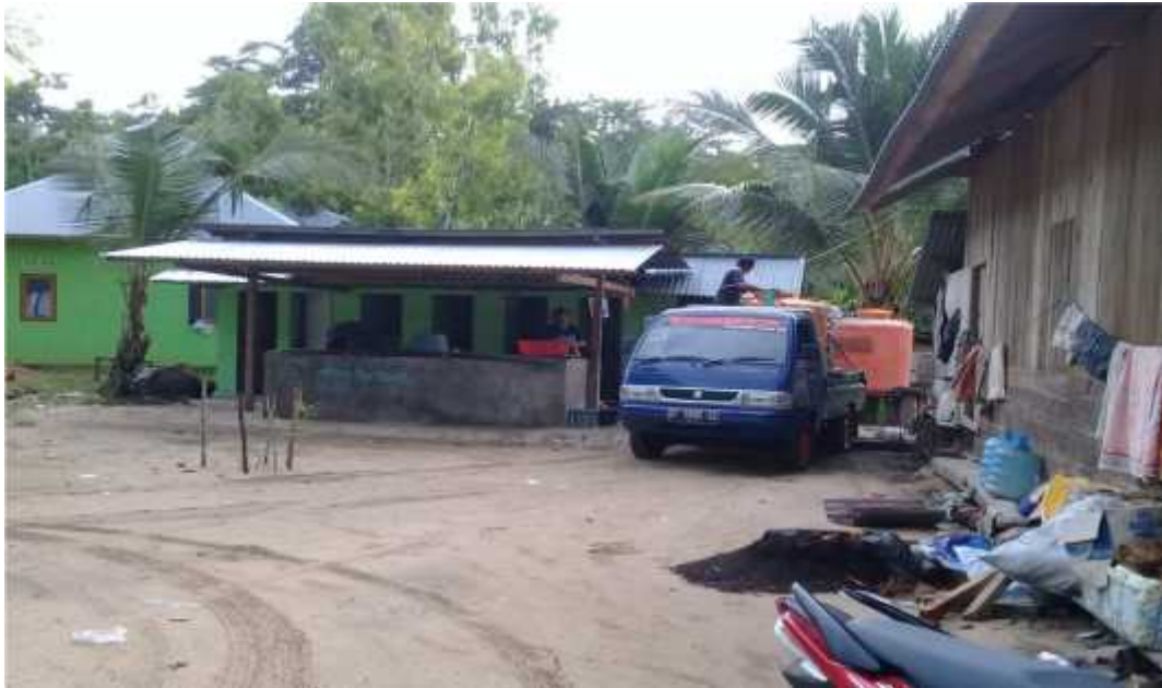
Fasilitas air bersih dan WC umum di kawasan obyek wisata pantai Toronipa