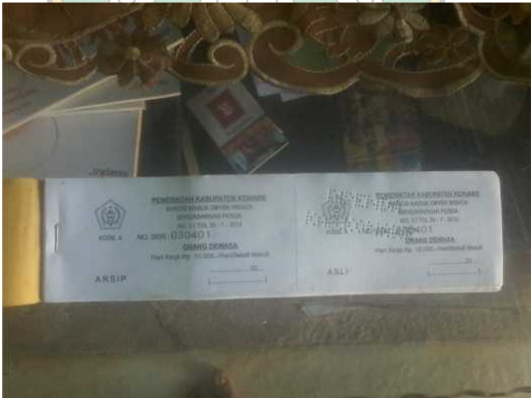
Foto karcis masuk obyek wisata pantai Toronipa