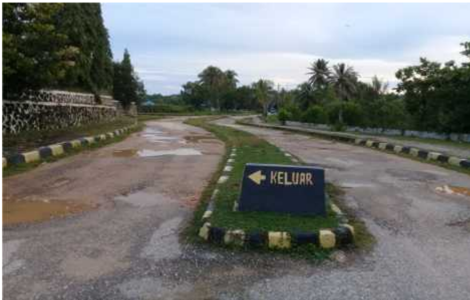
Kondisi jalan keluar masuk obyek wisata Pantai Toronipa