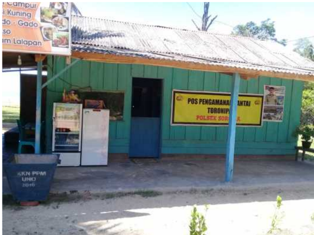
Pos pengamanan obyek wisata pantai Toronipa