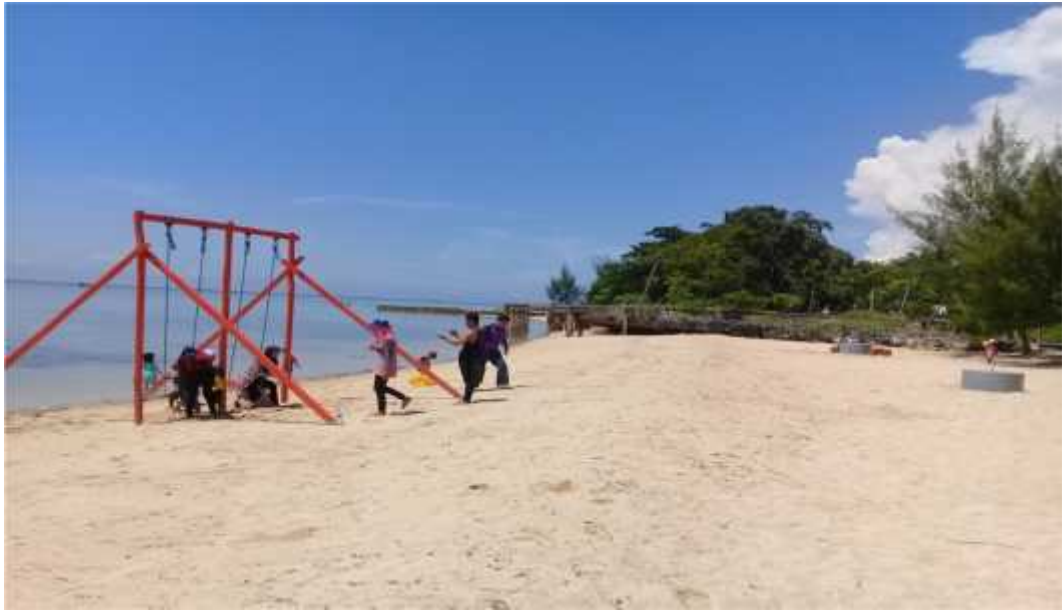
Hamparan pasir putih di obyek wisata pantai Toronipa