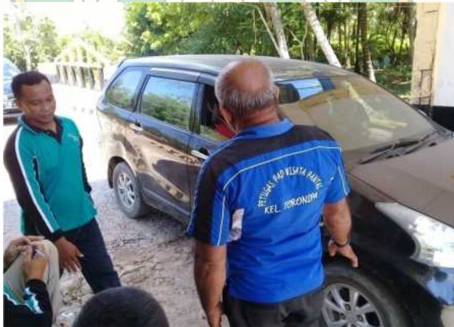
Proses pemungutan karcis yang dilakukan oleh petugas pemungut karcis