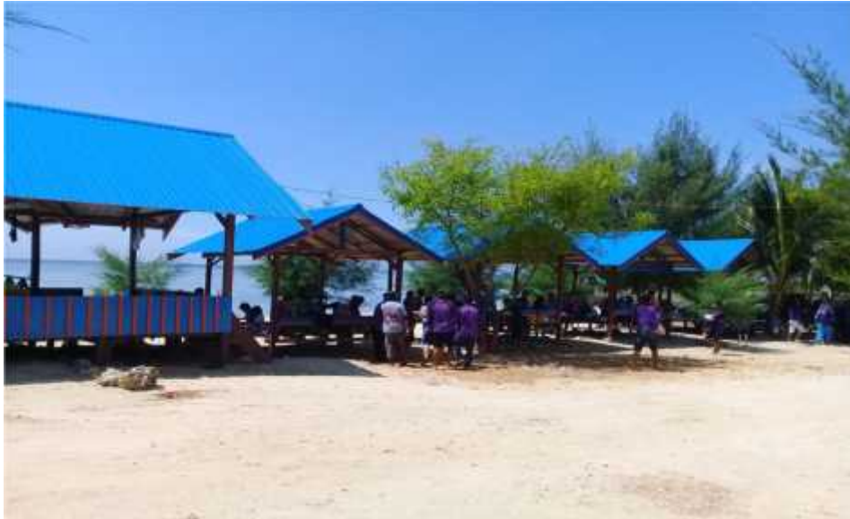
Fasilitas gasebo yang berada dikawasan obyek wisata Pantai Toronipa