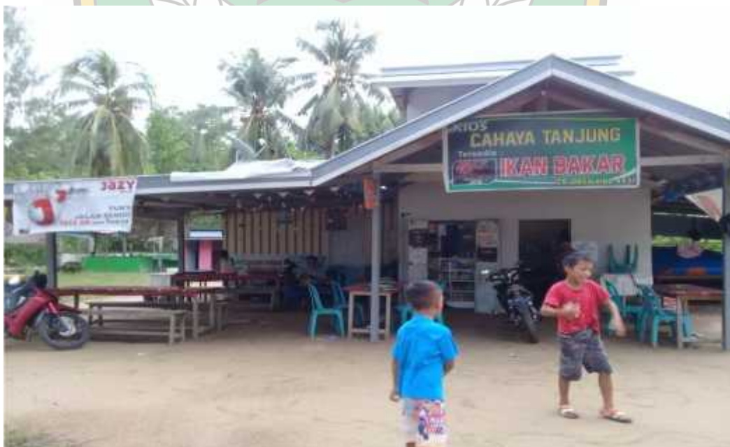
Fasilitas kios yang berada dikawasan obyek wisata pantai Toronipa