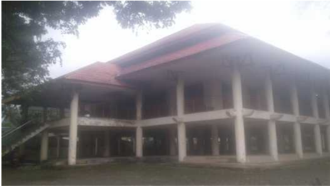
Kantor Dinas Pariwisata dan Kebudayaan Konawe