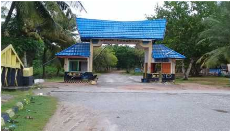
Lokasi obyek wisata pantai Toronipa kelurahan Toronipa kecamatan Soropia