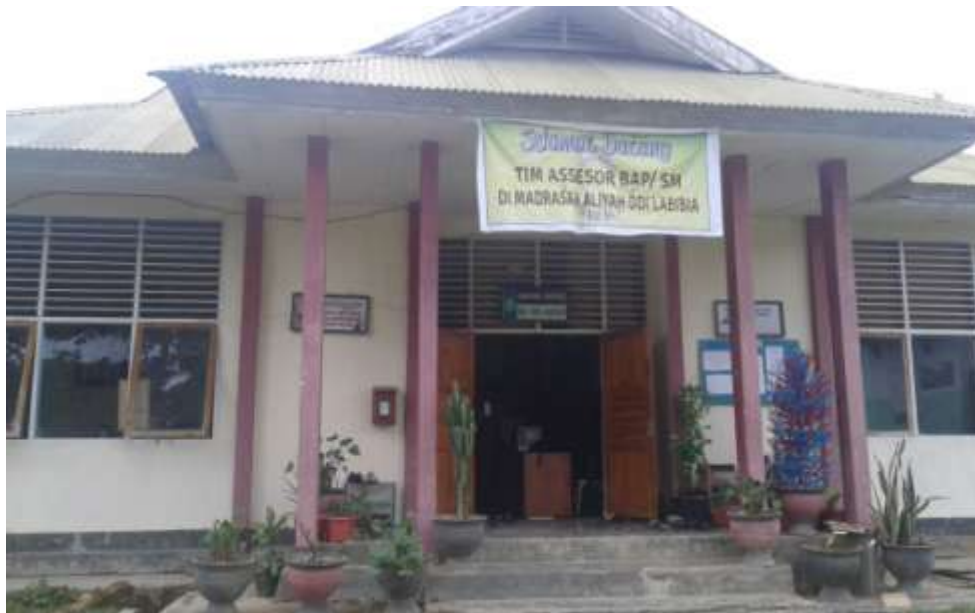
KANTOR MADRASA ALIYAH DDI LABIBIA