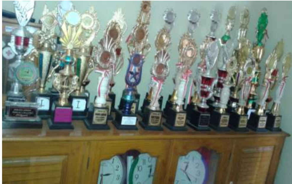
KOLEKSI PIALA MADRASAH ALIYAH DDI LABIBIA