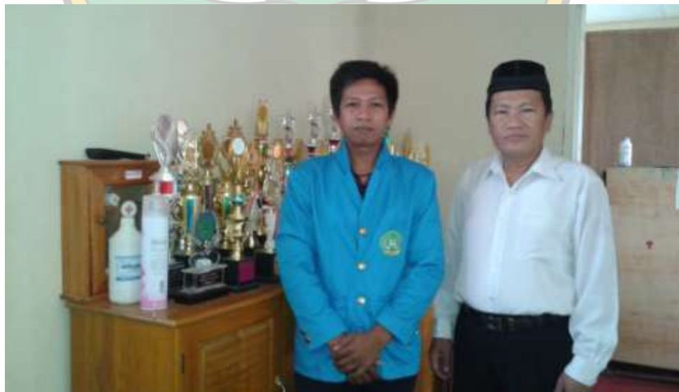
DOKUMENTASI PENELITI BERSAMA KEPALA SEKOLAH MA DDI LABIBIA