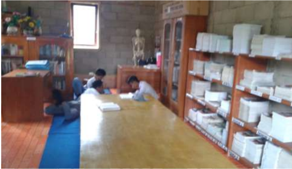
RUANG PERPUSTAKAAN MA DDI LABIBIA