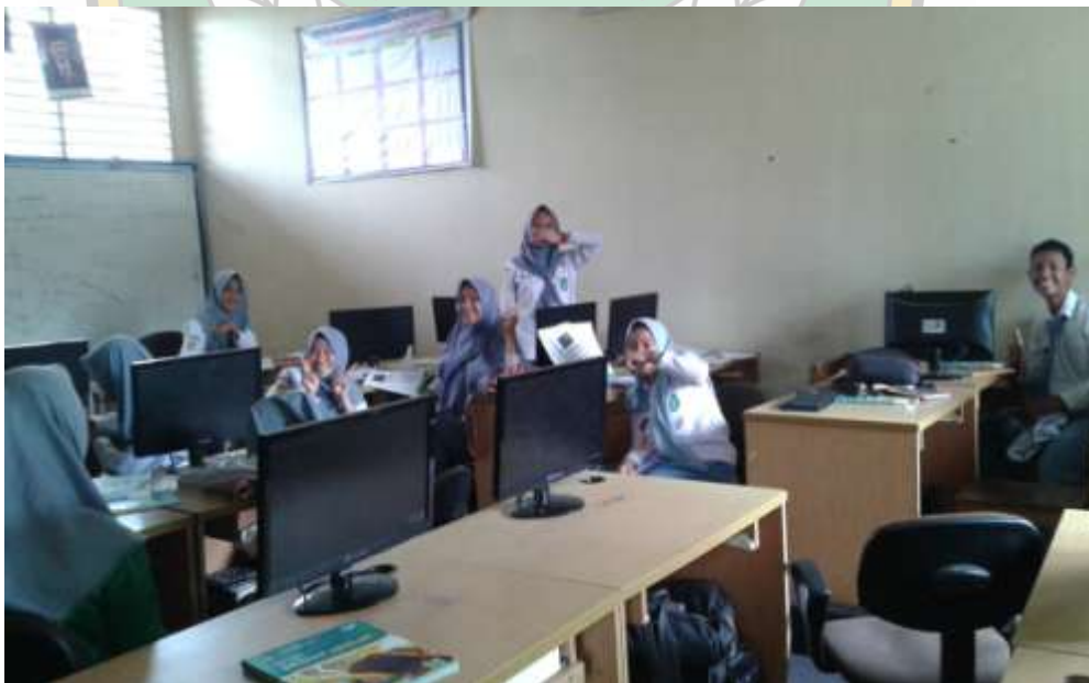
RUANG KOMPUTER MA DDI LABIBIA