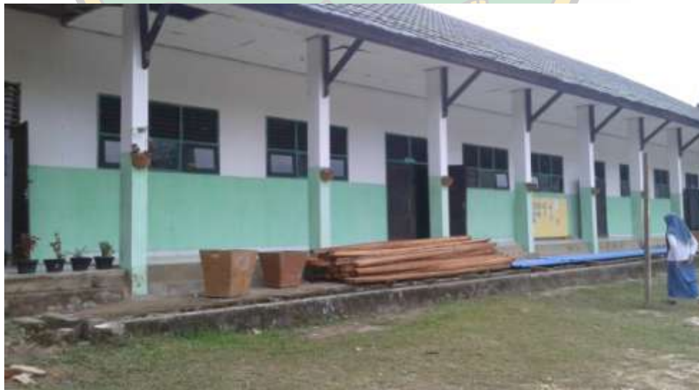
GEDUNG KBM MADRASA ALIYAH DDI LABIBIA