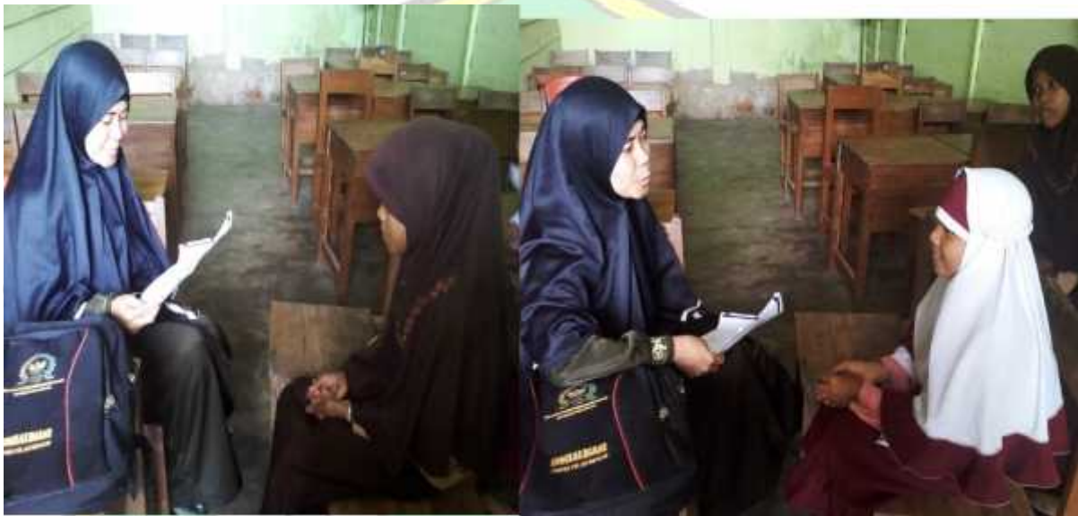
Wawancara dengan beberapa siswa kelas V