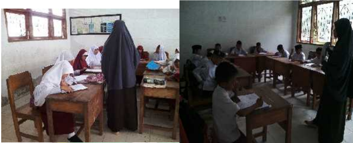
Peneliti membagikan Soal dan menjelaskan