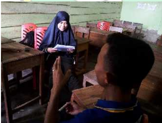
Wawancara dengan guru Fiqih