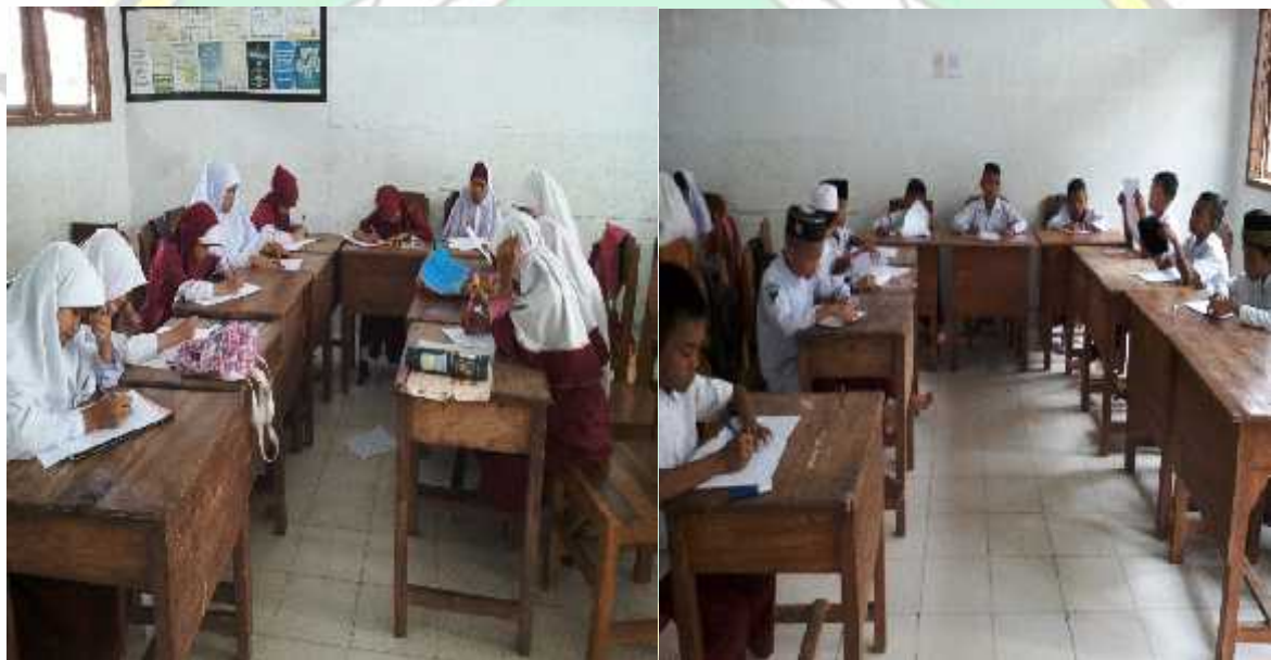
Siswa mengisi soal yang diberikan