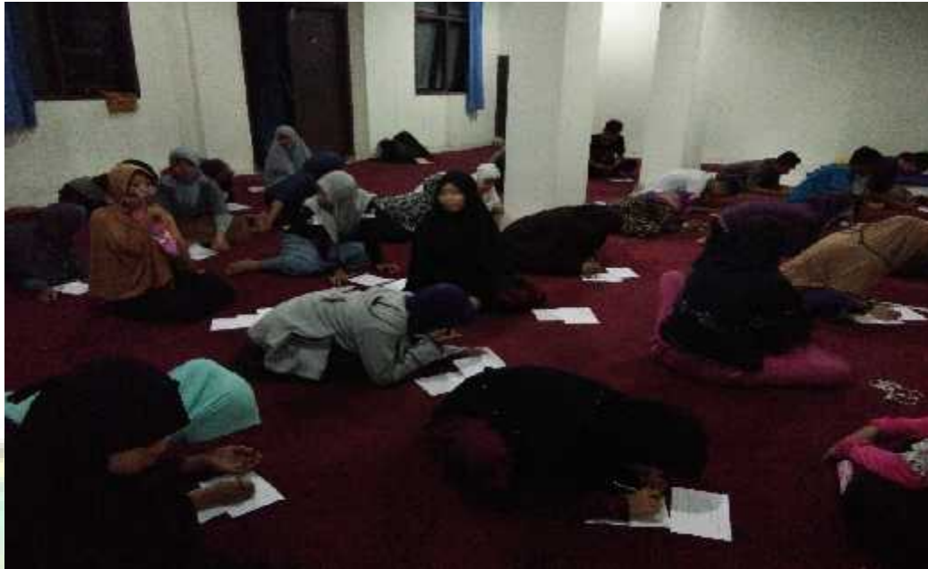
Suasana ujian akhir semester (UAS) mahasiswa Bidikmisi tahun ajaran 2016/2017