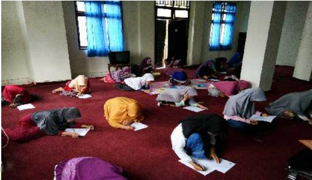
Suasana ujian tengah semester (UTS) mahasiswa Bidikmisi tahun ajaran 2016/2017