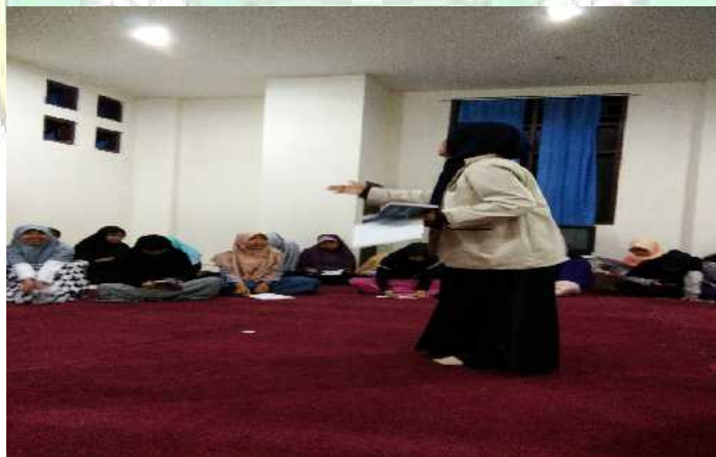
Praktek pidato bahasa Arab oleh mahasiswa Bidikmisi putri