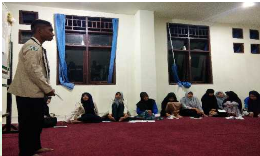
Praktek pidato bahasa Arab oleh mahasiswa Bidikmisi putra