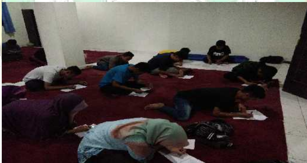
Suasana ujian akhir semester (UAS) mahasiswa Bidikmisi tahun ajaran 2016/2017