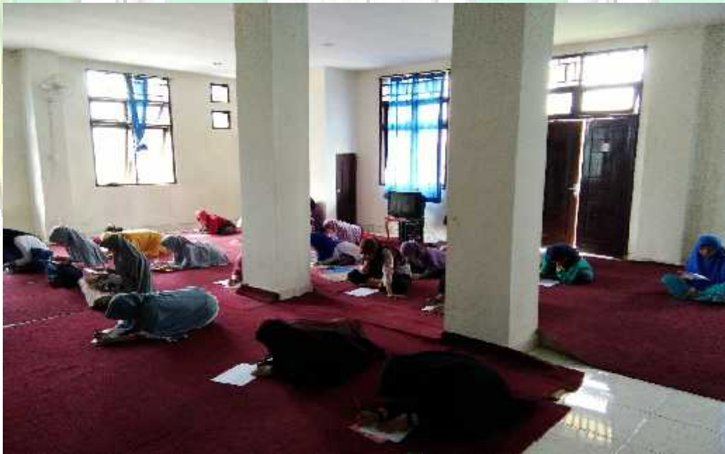
Suasana ujian tengah semester (UTS) mahasiswa Bidikmisi tahun ajaran 2016/2017